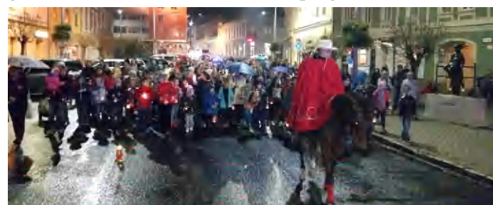
Szent Márton ismét lovon érkezett meg Tapolcára

ták a gyerekeket. Szépen fogott a forró tea, forralt bor, zsíroskenyér, sült alma- és tök, de a sütemény is. Sokan megtekintették a székesfehérvári Borostyán Hagymányörző Egyesület vikingjeinek bemutatóját, majd meggyújtották a lámpásokban a mécseseket és a lovon érkező Szent Mártont követve, sétával ért véget a negyedik tapolcai Márton napi ünnepség. (km)