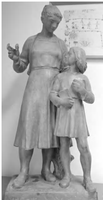
A tanítónő - Marton László alkotása

A tényéren az első három ujj valamit magyarázóan mutat, kinyújtott. A negyedik és ötödik a tenyérbe teljesen behajlítva látható. Tehát hármasság valamilyen formáját közli és mutatja fel. Marton