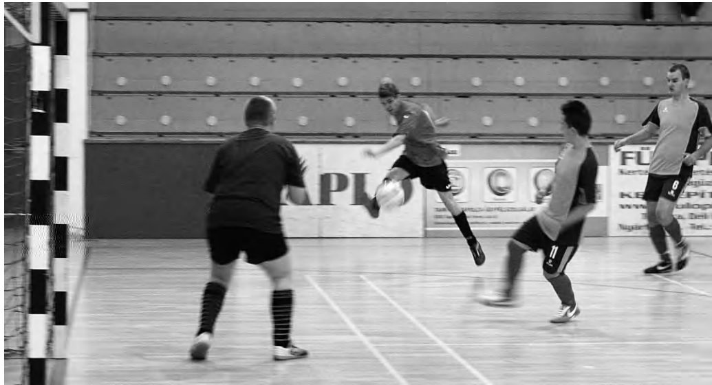
Sérültek küzdöttek egy célért ép sporttársaikkal a minapi tornán

Az eddigi legnagyobb csapatlétszámmal, huszonhét együttessel vágtak neki az értelmi fogyatékosokkal élő sportolók és partnerjátékosok a három napos küzdelmeknek. Az integráció jegyében meghirdetett sporteseményre cseh és szlovák csapatok is elfogadták a meghívást, így vált nemzetközivé a torna. Az ünnepélyes megnyitón Marton Gergő , az MSOSZ labdarúgó szakágvezetője köszöntötte a labdarúgókat és mutatta be a rendezvény meghívott vendégeit, többek között Nyilasi Tibor , hetvenszeres válogatott labdarúgót, a Magyar Labdarúgó Szövetség elnökségi tagját és Hrutka Jánost , az MSOSZ társelnökét. A helyi