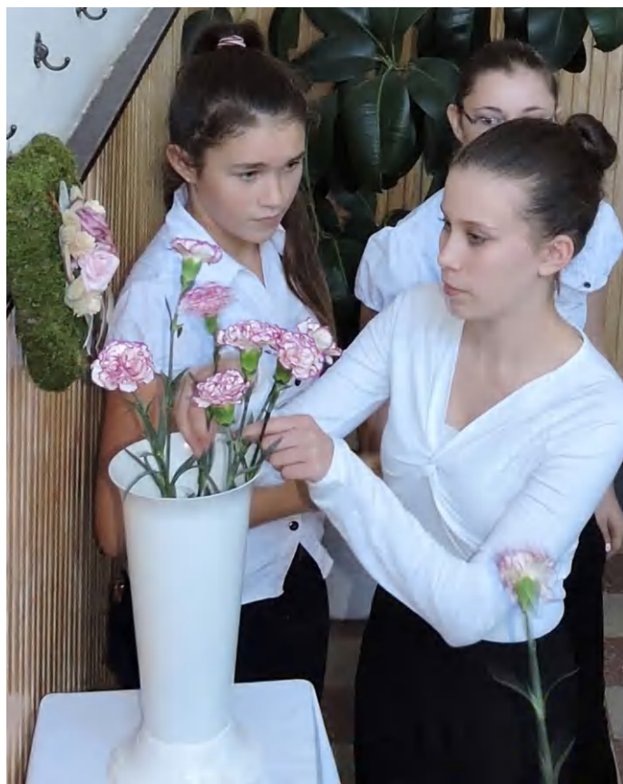
Virágot helyeznek el Bárdos Lajos emléktáblája alatt a zeneszerző nevét viselő iskola diákjai