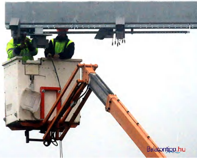
Egy októberi ködös reggelen készült képen éppen a Répa Rozi csárda elé szerelték fel a kamerákat a 84-es főút nemesvitai szakaszán

Még októberben a Répa Rozi csárda elé szerelték fel a kamerákat a 84-es főút nemesvitai szakaszán. Közvetlenül a parti sávban Vonyarcvashegyen készült el az első megfigyelőkapu. A község keleti részén, a 71-es főút és a Petőfi utca találkozásánál már az ősz eleje óta használatra készen áll berendezés. A kamerák számára mindkét irányban 3-400 méterre van szabad kilátás a falu belterületi szakaszán. Koordináták: 46.760561 17.328291. A nyugat felől jövők a Keszthelytől folyamatosan tartó lakott terület egy lejtős szakaszán feledkezhetnek meg az 50-es se-