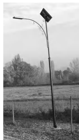
Napelemes lámpák világítják be a Nemesvita felé vezető út padkáját

gítanak. A rendszer így nem hálózati áramról működik, a falu költségvetéséből nem kell majd áramszámlára költeni. A lámpasort a napokban adták át ünnepélyes keretek között, az eseményre megmozdult a település lakossága. - A falu lakóinak több évtizedes vágya, megfogalmazott igénye volt a nyárfasorral szegélyezett vitai bevezető út kivilágítása, ám valahogy mindig másra jutott, mindig másra kellett a pénz. Egy ilyen oszlopos lámpa telepítése, építési engedélyt nem igényel, beton alapozással, bruttó 490 ezer forint, de mi referenciaként, „anyagáron” telepítettük, valósíthattuk meg a projektet. Napelemekre 10 év, lámpatestekre 5 év gyártói garancia van. Ugyanígyen lámpaoszlopokkal oldották meg Pétfürdőn, Sopronban, Záhonyban is az utak, parkolók, járdák, temetők, közterületek világítását. Az ő tapasztalataikra, s lassan a mi-