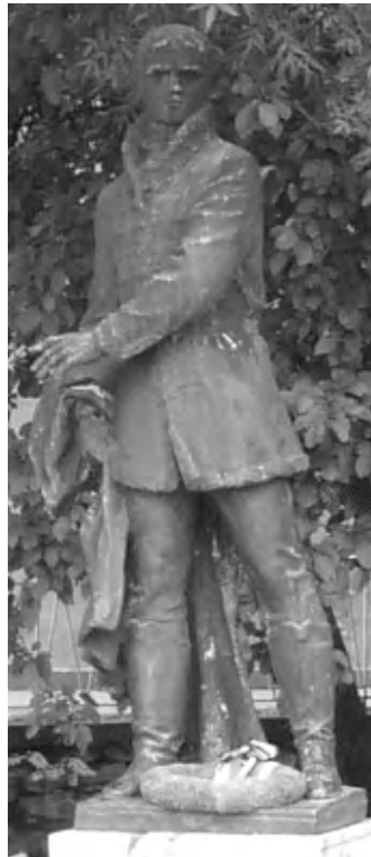
Batsányi szobra Tapolcán. Ápolják hagyatékát ma is szülővárosában

Az első érdemi alkalommal (2015. febr. 19-én) dr. Sárly Gyula főorvos úr tartott egy nagyon érdekes előadást a Szabadkőműves mozgalomról. A mozgalom egy-egy tagjával Batsányi nagyon fiatalon kapcsolatba került. Festetics György gróf, aki a keszthelyi, veszprémi majd soproni tanulmányait segítette, később Orczy Lőrinc, aki az első munkát adta neki és bevezette a társadalom felsőbb osztályának tagjai közé, és még talán Forgách Miklós gróf is, akinek személyi titkára volt, mindnyájan szabadkőművesek voltak. Lehet, hogy ez pusztán véletlen, de biztosan közrejátszott abban, hogy a szabadkőművesek névsorá-