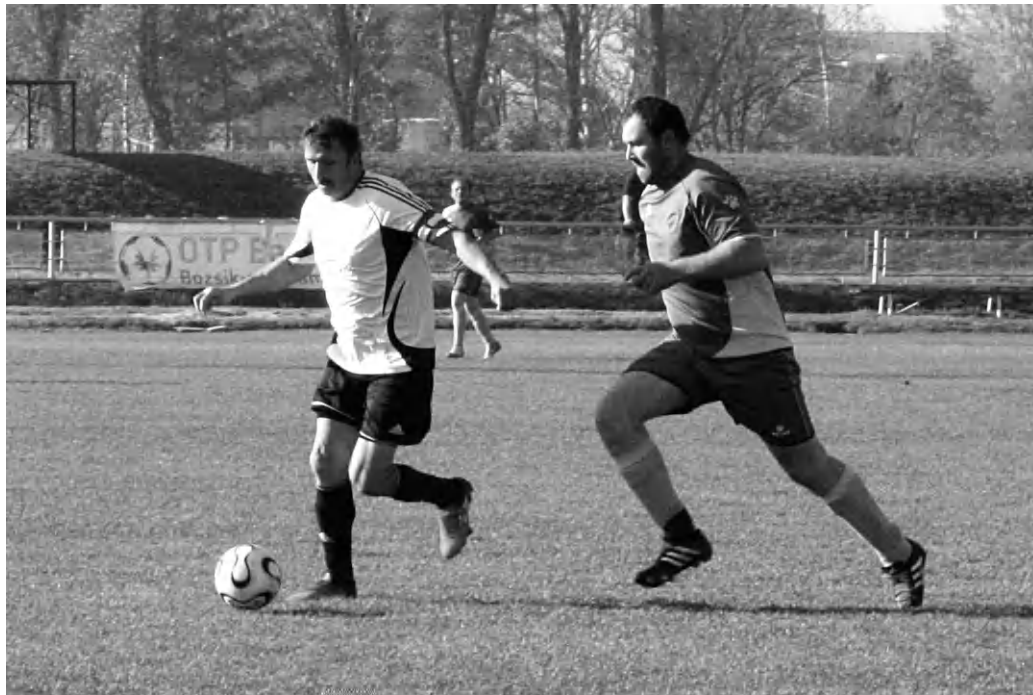
A városi rangadón a szervezettebben támadó csapat győzött