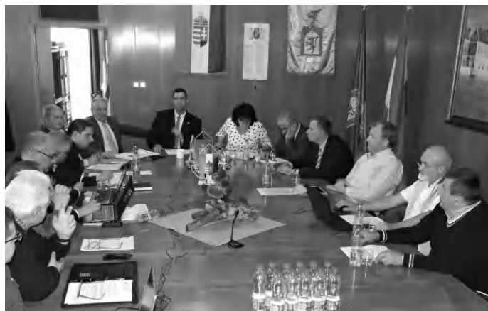
A rendkívüli ülésen a kórházi támogatás mellett egy intézményi téma került terítékre