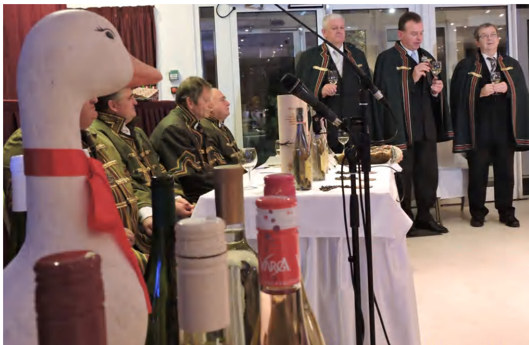
Liba és bor, Márton napján. A három új borlovagrendi tag (jobbra) az ünnepélyes eskütételt megelőző pillanatokban a nagytanács színe előtt

A Vinum Vulcanum Borlovagrend szombat esti ren-