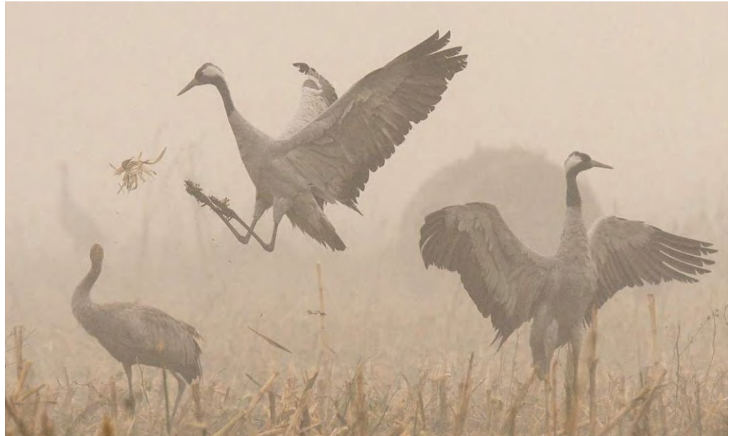
A darvak játékból tereptárgyakat dobálnak a magasba

A jelenséget a Hortobágyi Nemzeti Park területén, Balmaújváros térségében örökítette meg Pálincás Gábor természetfotós, akiről lapunk egy korábbi számában már írtunk a Tapolcai-medence hihehetetlenül gazdag madárállományára kapcsán. Annyit mindenképpen érdemes tudni róla, hogy térségünk vízivilágában előforduló, nagytestű madarak elhivatott és sikeres fotósa. Lapunknak elmondta, régi vágya volt, hogy egy kirándulás erejéig a Hortobágyon mostanában viszonylag nagy számban érkező darumadarak életét megörökíthesse. - Rendkívül óvatos, nehezen megközelíthető és fotózható madár a daru, természetes viszonyok között, mindössze hatvan méterre sikerült a közelükbe férköz-