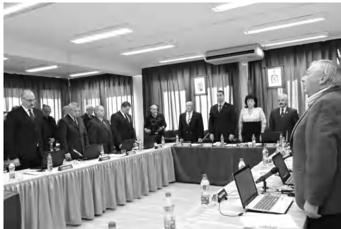
A tapolcai képviselő-testület a legutóbbi nyilvános ülésen egy perces néma gyászal emlékezett meg azokról az elhunytakról, akik a közösséget szolgálták.

A második napirendben foglalkoztak a képviselők az elismerő címek, helyi kitüntetések alapításáról és adományozásának rendjéről szóló rendelettel. Elsődlegesen a díszpolgári és tiszteletbeli polgári elismerő cím, mint különálló kategória megszüntetésének igénye merült fel, így a módosítás után csak a díszpolgári cím adományozható. Ez alapján hatályát veszti a rendeletben a tiszteletbeli polgárra vonatkozó rendelkezések. További változtatásként bekerült a rendeletbe, hogy a Tapolca Városért kitüntetés és a szakmai kitüntetések egy személy, vagy közösség ré-