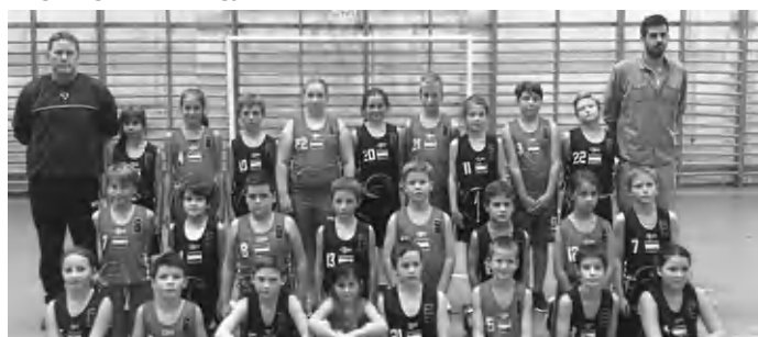
A tapolcai kosaras palánták szépen szerepeltek