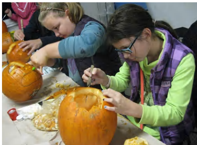
A szombati rendezvény középpontjában természetesen a tökfaragás, lámpakészítés állt