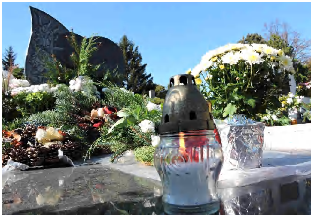
Halottaikról emlékeztek meg a hozzátartozók a temetőben

Kifejezetten a temető látogatói számára szervezte Péter atya és Balázs atya az elhunytakért történő közös imádkozást, amelyre - mint az kiderült - komoly igény mutatkozott. Sok tapolcai, és távolabbról, az itt nyugvó hozzátartozókhoz érkező látogató vett részt a temetőben első alkalommal, de mindenképpen hagyományteremtő szándékkal megszervezett fényünnepségen. A kápolnában az elhunytak lelkéért imádkoztak közösen, majd este szentmisén a templomban szintén. A hétfői halottak napját megelőzően, vasárnap a szokásos miserend megtartásával zajlott a mindenszentek Tapolcán. Péter atya lapunk kérdésére elmondta, hogy az emberekben nagy az igény arra, hogy halottaikról méltó módon emlékezhessenek