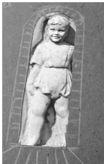
Szobor a kisfiú emlékére

H elytörténettel foglalkozó barátom sugalmazta, sétáljak nyitott szemmel temetőnk déli felében, kincset fogok találni. Tudom kincseket szoktak elásni, de a szavai szerint nem föld alatt kell kutakodnom, nagyon is látható a kincs. És ha rálelek is, legyek diszkrét. Hát a nap-sütésben ezért járok a sírok között. Nyolcvan éven túli orvos mélyen eltűnődve észleli, telve van temetőnk tapolcaiakkal, akiket személyesen ismertünk. Nini, ovális üveges keretből éppen egy diákkori kislány mosolyog rám, egy sírkőről. De biztosan nem ő lenne a beígért kincs. Egyszerre csak földbe gyökerezik a lábam. Közel megyek a látottakhoz. Gyermeksírra lelek, de sírkövén nem látok nevet, évszámot, csak egy szépen, kőből faragott kisgyermek-figurát. Annyira szép, annyira lenyűgöző megjelenítése, hogy azonnal súgja egy belső hang, rátaláltál. Műalkotás, csak tehetség alkothatta.