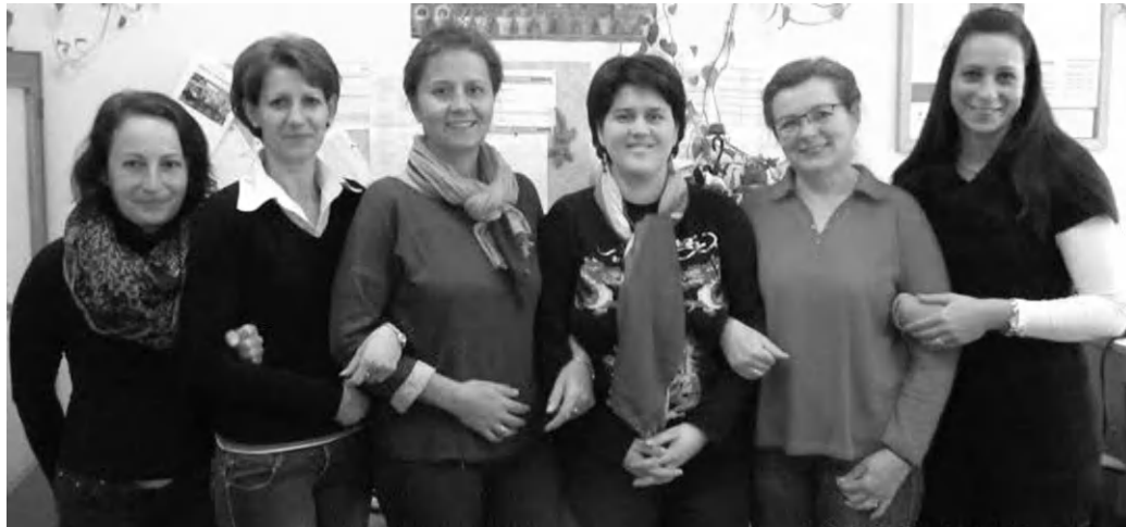
A tapolcai családsegítők igyekeznek jobbá tenni mások életét

- 2015. július 1-e óta látom el a Szociális és Egészségügyi Alapellátási Intézet Családsegítő és Gyermekjóléti Szolgálatának szakmai vezetését. Ezt megelőzően 2010. április óta családgondozóként dolgoztam ugyanitt. Viszonylag későn, 39 évesen jutottam el odáig, hogy megtaláljam azt a tevékenységet, amit teljes szívvel és odaadással tudok végezni. Addig teljesen elfoglalt a három gyermekünk nevelése, a férjem vállalkozásának elindítása, szinten tartása. Meggyőződésem, hogy a megfelelő bizalom kiépítésével minden ember hajlandó és képes a pozitív változásra. Ez az erős hit az alapja az eddig végzett munkámnak, ez ad erőt, hogy az apró, kívülről talán láthatatlan, a családok életében történő változásoknak örülni tudjak, és,