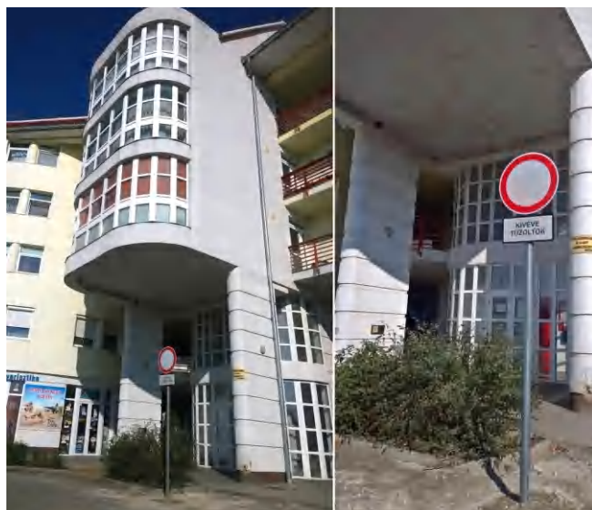
A tábla október harmincadikán visszakerült eredeti helyére a Nagyköz utcában.