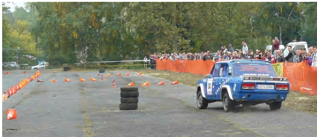
Autóverseny a volt Dobó laktanya területén - nagy érdeklődés mellett