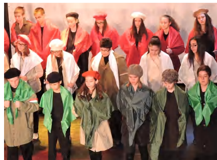
A gyerekek végigvezették a nézőt az 56-os események főbb fordulójain, látványos jelenetek, érdekes koreográfiák, zenés részek váltották egymást

műsor létrejöhessen. Az igazgató a Tamási Áron Művelődési Központnak is megköszönte az ideális helyszín biztosítását. (szj)