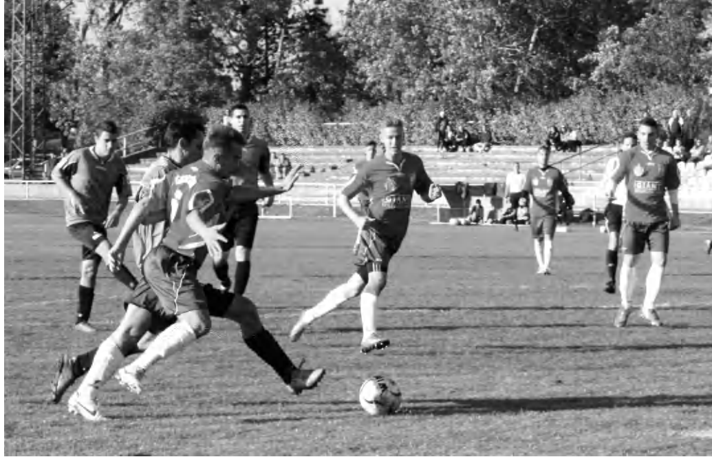
Öt gólt kapott, de egyet sem szerzett a TIAC VSE a jó erőkből álló Veszprémtől a hétvégi megyei I. osztályú labdarúgó bajnoki mérkőzésen

A napi rendszerességgel edzést tartó, azokon aktív részvételt mutató veszprémi fiatalok találkoztak, a heti egy tréningen résztvevő, rutinosabb játékosokból álló hazaiakkal. A megyeszékhelyi gárda magabiztosan vezeti a bajnokságot, míg a 18 csapatos mezőnyben a 16. helyet foglalja el a TIAC. A két csapat közti pontbeli különbség a mérkőzést megelőzően 18 pont volt, a Veszprém 10 mérkőzésből kilencszer nyert és csupán 1 döntetlent játszott, míg a tapolcaiak mérlege 2 győzelem, 4 döntetlen és 4 vereség volt. Nyugodt szívvel lehet tehát az osztálykülönbség szót használni a találkozóra. A vendégek az első perctől kezdve szebbnél szebb akciókat ve-