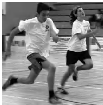
Immár negyedszerre versenyeztek a „szöcskék” a csarnokban a

sporteseményen, akadt, aki több versenyszámban is indult. Versenyeztek a tapolcai iskolák tanulói, továbbá képviseltette magát Badacsonytomaj, Révfülöp, Nemesgulács, Monostorapáti és a Lesence-régió. Nemenként, két korcsoportban - III. (2003-2004-ben születettek), valamint IV. (2001-2002-ben születettek) korcsoport - öt kategóriában (30 méter síkfutás, helyből távolugrás, medicinlabda dobás, magasugrás, váltófutás)