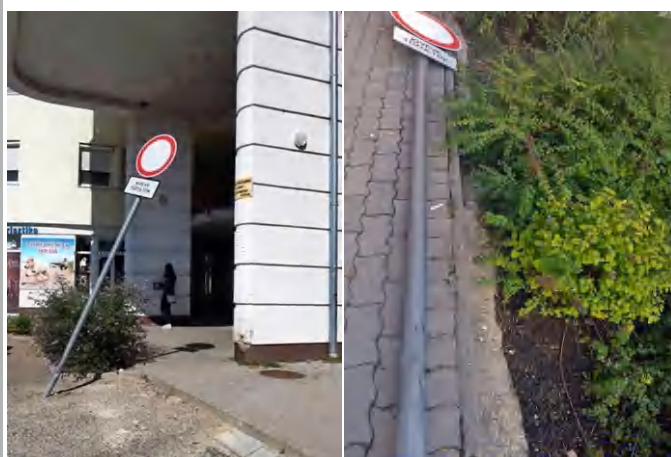
Egy közúti jelzőtábla "halála"

Ebben az állapotban balesetveszélyt jelentett, így a közelmúltban valaki „megkegyelmezett” neki, és egy félre-eső helyre fektette. Ez a jelenlegi állapot, de reméljük, hogy nem a végleges. (di)