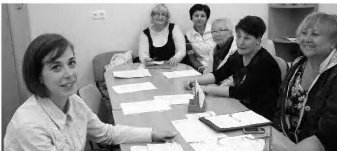
A házi segítségnyújtás tapolcai munkatársai

téneti ismeretek, informatika szakkör). Új tanulási formák keretében kihelyezett természetismeret órák keretében a Veszprémi Állatkertben 21 csoport számára, ezen kívül Amerikai kuckó program valósult meg a két tanítási nyelvű osztályok részére. A pedagógusok szakmai fejlődésének elősegítése érdekében 25 félé továbbképzésen összesen 123 pedagógus vett részt. A tartalmi fejlesztéseken túl az iskola igen jelentős, az új elemekkel bővülő oktatási-nevelési munka megvalósítását szolgáló eszköztámogatásban is részesült. Interaktív tananyagok, interaktív táblák, projektorok, laptopok, nyomtatók, multifunkciós eszközök kerültek beszerzésre. A mindennapos testnevelés bevezetéséhez szükséges felszerelések biztosítása is a pályázati forrásból valósult meg.