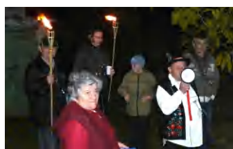
A fáklyás bortúra