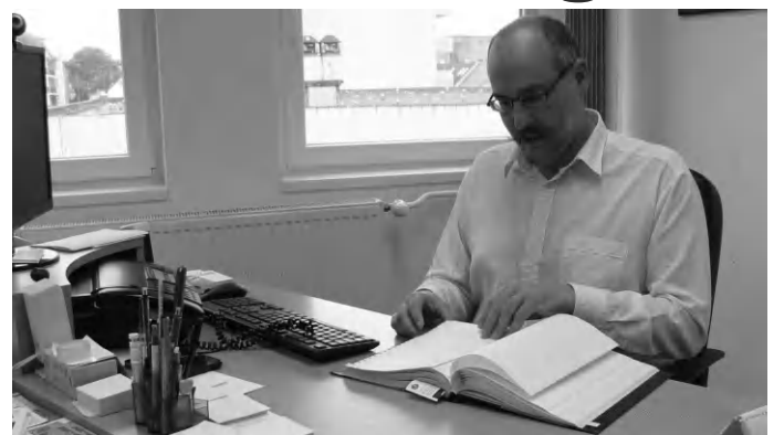
A könyvtár olvasói a közeljövőben interneten is megtalálhatnak sok helytörténeti információt