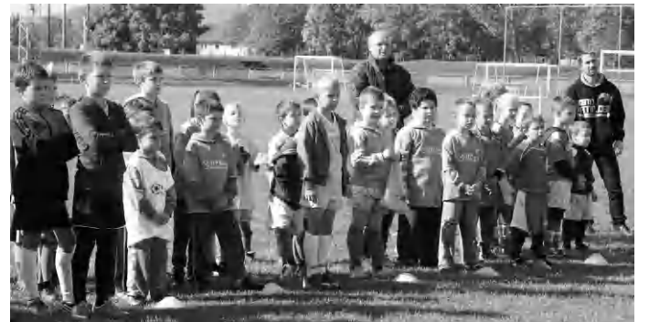
Hét egyesület legkisebbjei rúgták a bőrt