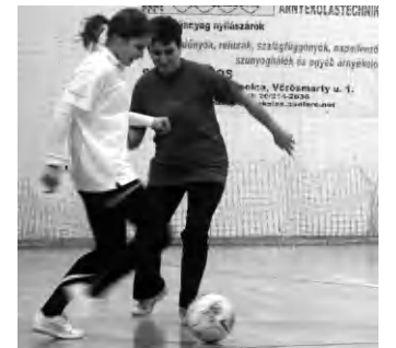
Izgalmas meccs, a barátság jegyében

drukker a vereség ellenére tapssal díjazta a játékosokat, hiszen a vendégek csapatában több tapolcai származású labdarúgó is játszik. Munkájuk, iskolájuk, életük Veszprémbe irányította őket és onnantól kezdve az ottani csapatot erősítik, mint látjuk eredményesen. (hg)