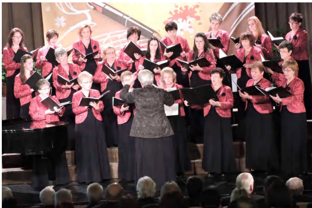
A Tapolcai Kamarakórus a színpadon, a szombati kórustalálkozón

Elsőként a Tamási Áron Művelődési Központ művészeti csoportjaként működő Tapolcai Kamara Kórust hallhatta a közönség. Az 1992-ben alakult kórus repertoárja a zenetörténet minden korszakából tartalmaz műveket, de kiemelt figyelmet fordítanak a magyar szerzők alkotásainak bemutatására. A Török Attiláné karnagy által irányított csoport értéket közvetít. Az évek során