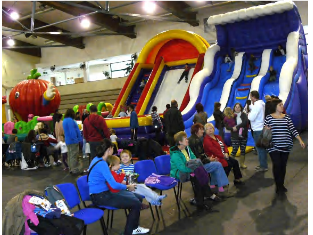
Gyermekek paradicsoma, óriás játékok a csarnokban hétvégén.

Ennek leginkább a tapolcai és környékbeli kisgyermekek örültek, de a helyet biztosító intézménynek is kell a bevétel. Szombaton délelőtt már tíz órától tömve volt a csarnok parkolója, sokan ugyanis a környék településeiről érkeztek, a tapolcai szülők, nagyszülők mellett ők is elhozták csemetéiket a nem mindennapi szórakozási lehetőség kedvéért. A csarnok küzdőtere hatalmas méretű, felfújható csúszdával, várakkal volt tele, rajtuk alig néhány éves gyerkőcök lógtak, megrészegülve a kihívástól, a magasságtól és az óriás méretű játékokon való ugrálástól, lecsúszástól, egyensúlyozástól. A rendezvény, mivel azt egy magán-cég rendezte, természetesen nem volt ingyenes, a felnőtt-jegy négyszáz forintot ért, a kicsik belépő jegyért min-