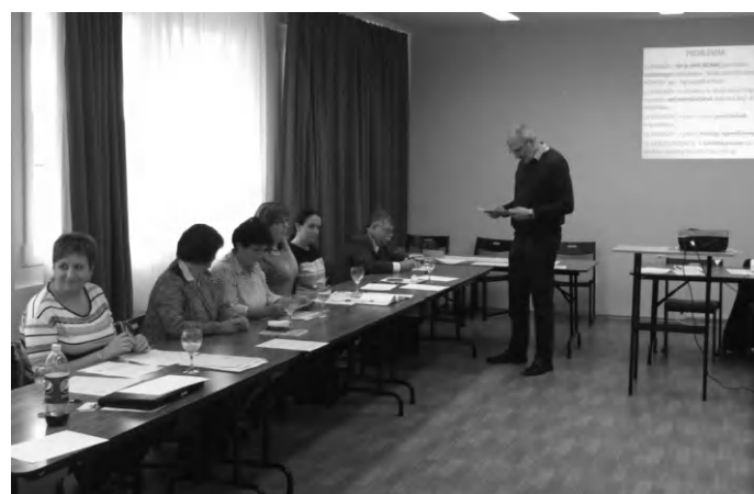
„Esélyteremtő attitűd formálása” - akkreditált képzés

A jelenlevők többek között a koordináció, a mentorálás, az esélyegyenlőség, az integráció, a multikulturalitás, a sztereotípiák, a kooperáció, a konfliktus, a csoport, az együttműködés, valamint a csapatmunka témakörében szerezhettek ismereteket, valamint az attitűdök, a módszertani kompetenciák,