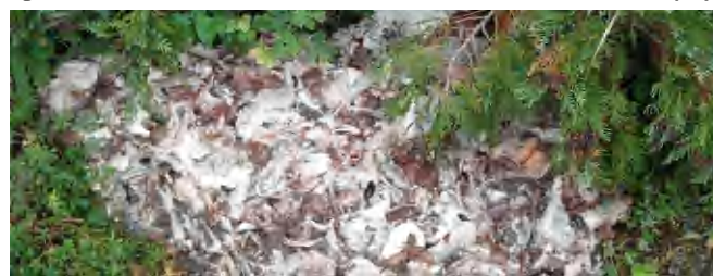
Íme a két ismeretlen halbelsőséges „produkciója”

Kérdés, hogy megérte a Tópartról ideig felhozni a pisztráng belsőségeket? Én nem látok benne logikát. Másfelől, miért az én magánterületemre öntötték ki, mikor a háztól tíz méterre található egy szelektív hulladékgyűjtő sziget, ami ennél mindenképpen ideálisabb helyszínnel szolgált volna. Remélem, hogy a két elkövető olvassa a Tapolcai Újság SZEM-PONT rovatát, és minimum elnézést kérnek, ugyanis felírtam a személygépkocsi típusát, színét és rendszámát is! - mondta olvasónk. (di)