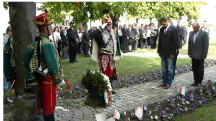
A város koszorúja a vértanúk emlékkövénél