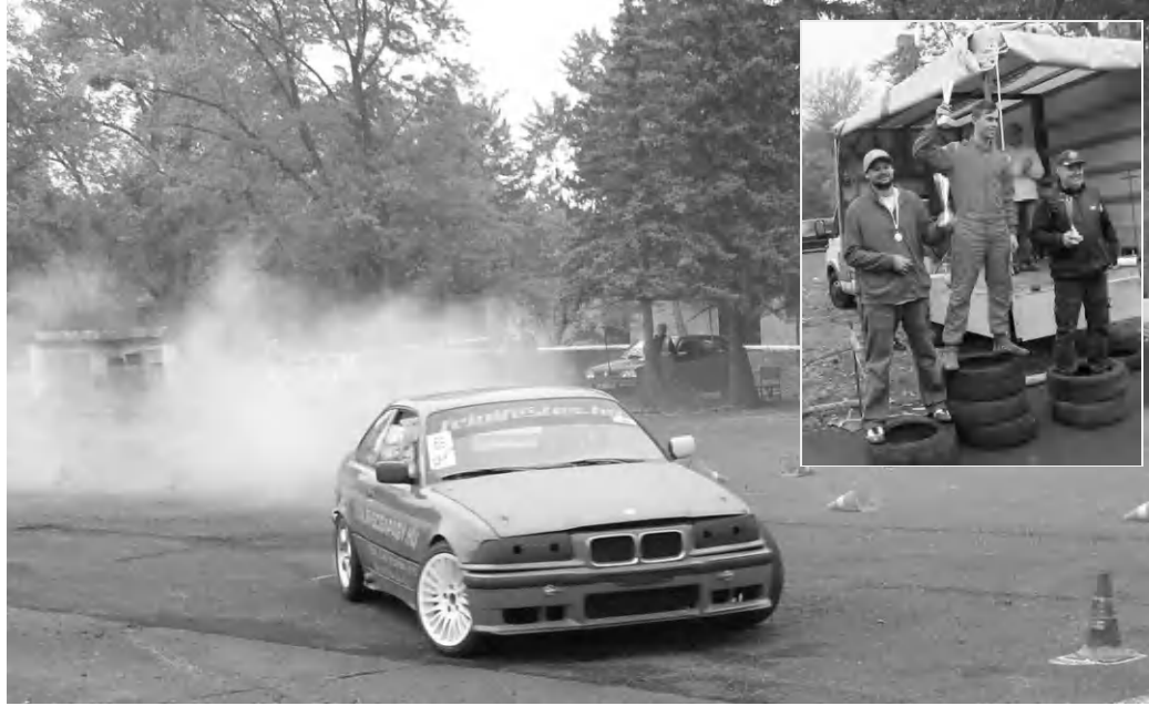
Tapolcán rendezték a Dunántúli Szlalom Kupa versenysorozat utolsó előtti fordulóját szombaton. A kis képen az abszolút verseny dobogósai

A technikai sportokat, ezen belül is az autós ügyességi versenyeket nagy érdeklődés kíséri országshoz, igazi különleges atmoszférával bír, amatőr sportesemények ezek, ahol versenyző és látogató azonos hullámhosszon van, imádja a technikát, a száguldást, és a szabadtéri bulit. Ez év májusában adott először otthont Tapolca a hajdani Dobó laktanya területén a DSZK versenynek, már akkor kiderült, hogy a jelentősen leromlott állapotú terület igencsak alkalmas a verseny lebonyolítására. Akkor, remek napfényes időben többezren látogattak ki a versenyre, hatalmas volt az érdeklődés és ennek meg-