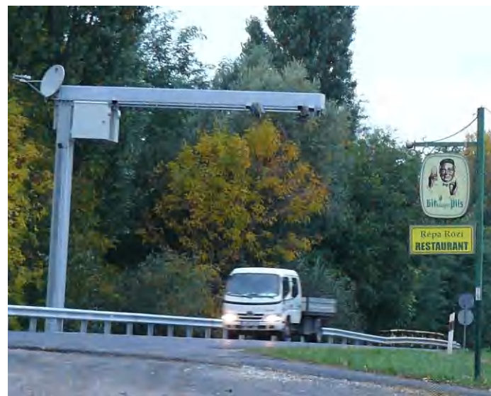
Sebességet mér, de felismeri majd a rendszámot, fogalmat számol, szabálysértést észlel