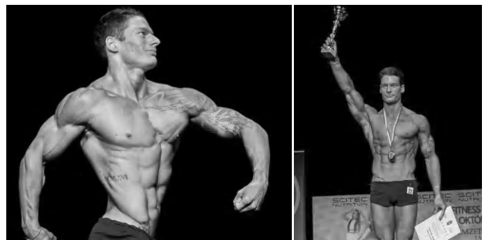
Két aranyéremet is szerzett a tapolcai fiatalember