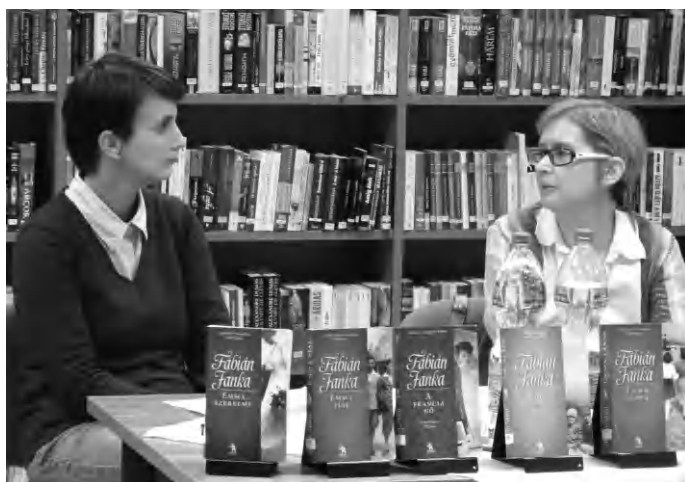
Közönségtalálkozó Fábián Jankával a könyvtárban

Intézményünk az idei évben is csatlakozott az Országos Könyvtári Napok elnevezésű programsorozathoz. Ennek keretei között hívtuk meg Fábián Janka írónt könyvtárunkba, aki rögtön „megfogta” a hallgatóságot kedves, közvetlen, természetes egyéniségével. A századforduló sajátos hangulatát idéző romantikus történelmi regényeit - többek között A német lány , Az angyalos ház , a Lotti öröksége című köteteket - könyvtárunk olvasói is előszeretettel kölcsönzik és olvassák. Beszélgetőtársa, Péringer Petra könyvtáros először arról faggatta az írónt, hogy mikor és milyen indíttatásból fogott hozzá az íráshoz. Fábián Janka elmondta, hogy már gyermekként nagyon szeretett olvasni és tízévesen maga is megpróbálkozott a verseléssel, később naplót vezetett, majd - az idők során gyűjtögetve az ötleteket és az anyagot - 2008-ban kezdte írni első regényét, amikor a pénzügyi válság miatt nyelvtanítónak vége-