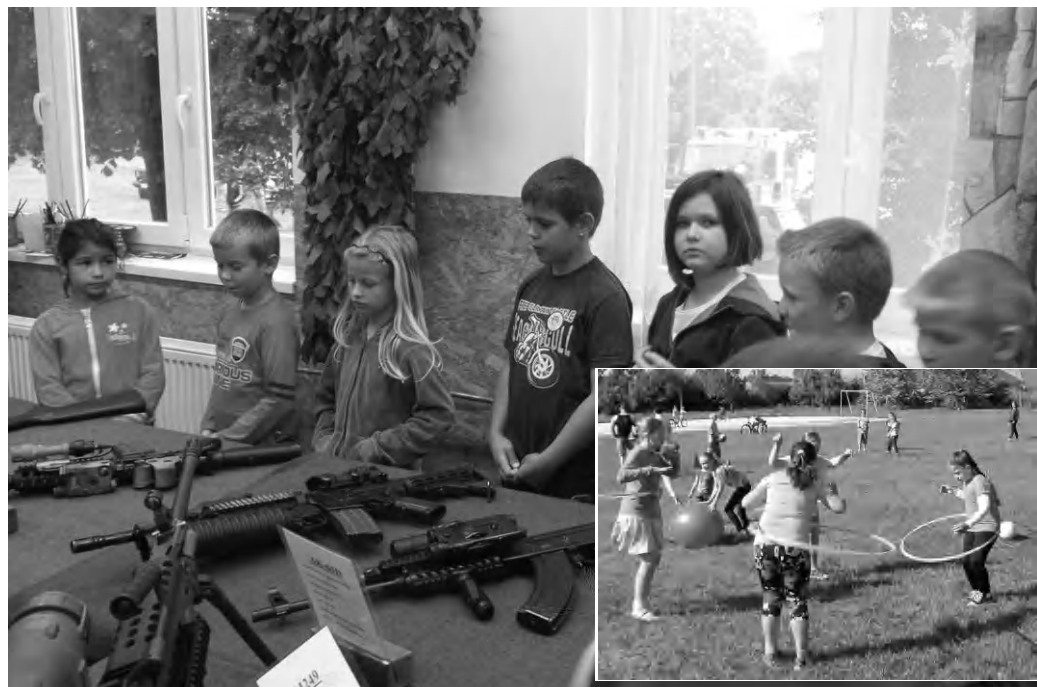
A fegyverekkel való ismerkedés és a sport is szerepet kapott a pályázat folytatán