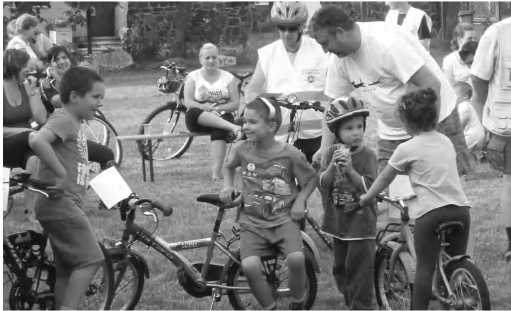
A kerékpáros közlekedés népszerűsítését nem lehet elég korán kezdeni - egyebek között erről is szól a mobilitási hét

Szeptember 16-tól 22-ig az Európai Mobilitási hét tapolcai eseményeinek ideje alatt leadhatjuk forgalmi engedélyünket, később ezt természetesen (a programsorozat végén) visszakapjuk. A forgalmi engedélyeket szeptember 16-án a tapolcai Városi Moziban adhatjuk át a szervezőknek és szeptember 22-én kaphatjuk vissza azokat. A rendezvényre hagyományosan a Fő téren kerül sor, ahol a forgalmi leadók között értékes ajándékokat sorsolnak ki. A hét programjai közé tartozik a 16-án délután fél háromkor kezdődő, a csarnoktól induló és oda visszatérő „FÖLDönfutók” futóverseny általános-