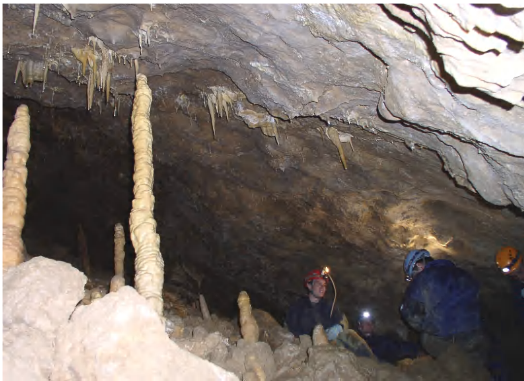
Kettős évforduló előtt a balatonedericsi Csodabogyós barlang