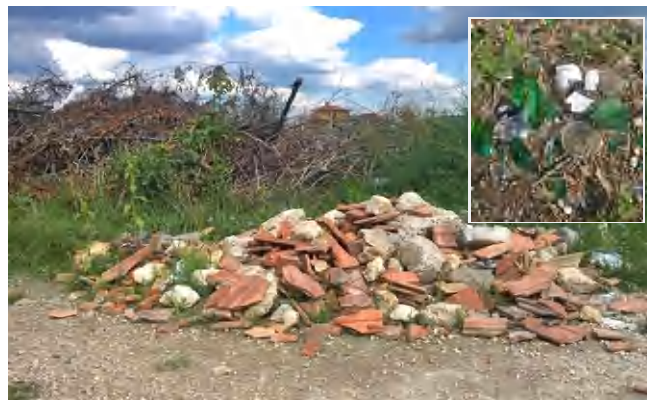
Szemét, törött üvegek, lehangoló látvány a Barackos lakópark és Y- házak mögötti területen

Nem messze innen, a Tapolca Keleti Városrész táblától néhány méterre pedig szeméthalom éktelenkedik, amely nagymértékben rontja az utcaképet minden irányból. Mint mindig, az elkövető ismeretlen, anonim személyt pedig nem lehet szankcionálni. Mindkét esetben az a legszomorúbb, hogy nem történik intézkedés. (di)