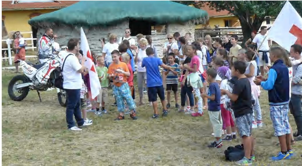
Boldog gyermekcsoporthat az Afrika Múzeumban

A Balatonyörökön működő "Hétsoda Élménytábor" lakói számára nem mindennapi programot szervezett a Vöröskereszt, karöltve a vendéglátó Afrika Múzeummal és több céges támogatóval. Az állatkertben megtapasztalható, látható egzotikus állatvilág megtekintése mellett ugyanott sivatagi autós, kamionos, motoros bemutatóval, nyomolvasó játékkal, kézműves- és afrikai zenés foglalkozással igyekeztek feledhetlenné tenni a gyerekek számára a napot. Az esemény sztárvendége, konferansziéja Kőváry Barna autóversenyző volt, aki technikai sportokban szintén sikeres kollé-