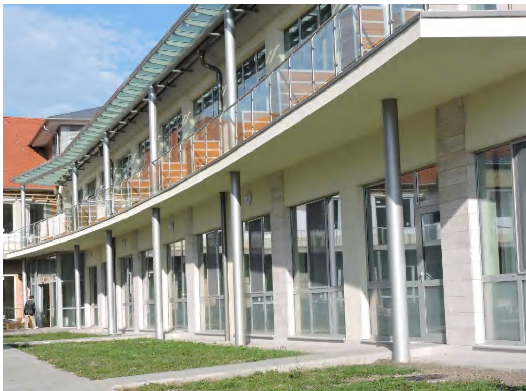
Az új épületszárny már július végétől a betegek szolgálatában

A Tüdőgyógyászati Rehabilitációs Szakrendelő és Gondozó változatlanul a Rendelőintézet második emeletén fogadja betegeit. Sürgős beutalóval a Rendelőintézet első emeleti hívószámot pultjánál kell jelentkezni, a betegirányítás onnan történik a szakrendelésekre. Emellett ki kell emelni, hogy a kórház területén zajló építkezés munkálatai továbbra is folynak, így az egyes rendelések megközelítése foko-