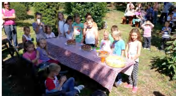
Három tortával ünnepelték a hónap születés- és névnaposait