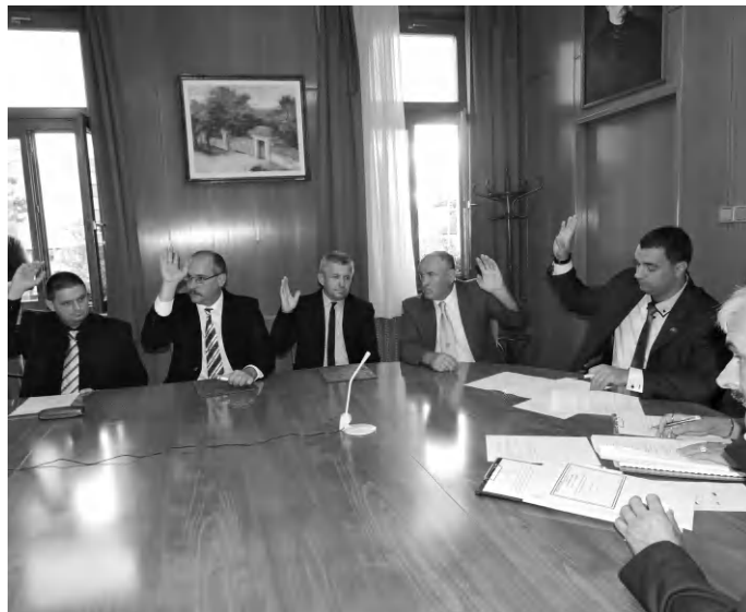
Pénteken délelőtt a Tamási Áron Művelődési Központban ül össze a tapolcai a testület

Az ülésen vis maior pályázat benyújtásáról is döntenek, várhatóan változik a közbeszerzési terv, jóváhagyják az Integrált Településfejlesztési Stratégiát (ITS), illetve döntenek a város 2015-2020. közötti időszakra vonatkozó Környezetvédelmi Programjáról. Napirenden