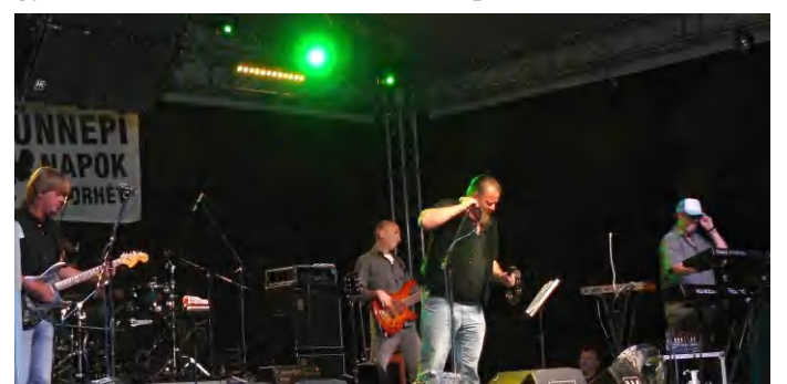
A „szolid nemzeti rocker” Ismerős Arcok zenekar Tapolcán koncertezett a közelmúltban

A Kerítést bontok című (2012-es lemez címadó dala) szerzeményük - mostanában félreérthető, ezért Nyerges úgy érezte el kell magyaráznia azt a közönségnek: „Ez nem az a kerítés, mert azt lehet, hogy tényleg meg kell építeni.” (tl)