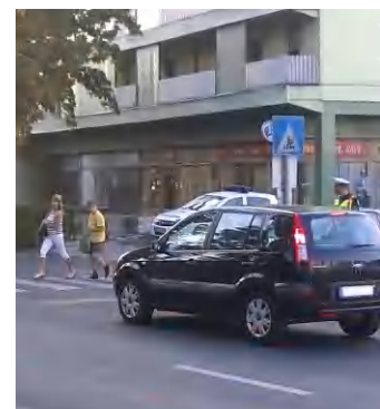
Az oktatási intézmények vonzáskörzetében rendőrök figyelnek a biztonságos közlekedésre

és egyéb, a bűncselekmények, valamint az áldozattá válás megelőzése érdekében közvetített fontos szabályokról - tájékoztatta lapunkat Nagy Judit a Tapolcai Rendőrkapitányság megelőzési főelőadója. (di)