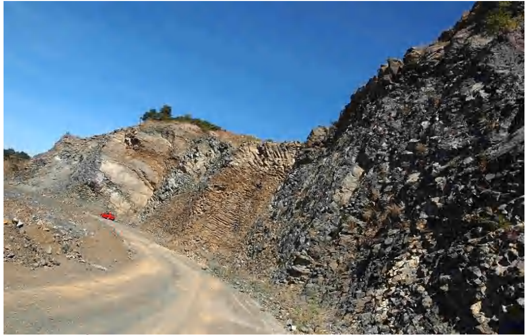
Fantasztikus látványt nyújtanak a tornyosuló bazaltóriások

Az egyik ilyen különleges látnivaló Tapolca és Sümeg felől is megközelíthető a 84-es számú főúton. Uzsabánya - Alsó vasúti megállóhelynél nyugati irányba kell lekanyarodnunk. Néhány száz méter után egy tábla is köszönt bennünket a településen, Uzsán. Innen még kanyargós úton, körülbelül tíz pernyi utazás után érkezünk meg a Láz-hegy egyik legfontosabb pontjához. Itt egy biztonsági őr fogad bennünket, ugyanis csak írásos engedély után juthatunk tovább úti célunkig. Ennek magyarázata: egyfelől még nyílt színi bányaművelés folyik, másrészt a terület a Bazalt- Középkő Kft. tulajdona. Az engedély bemutatása után egy gépkocsival