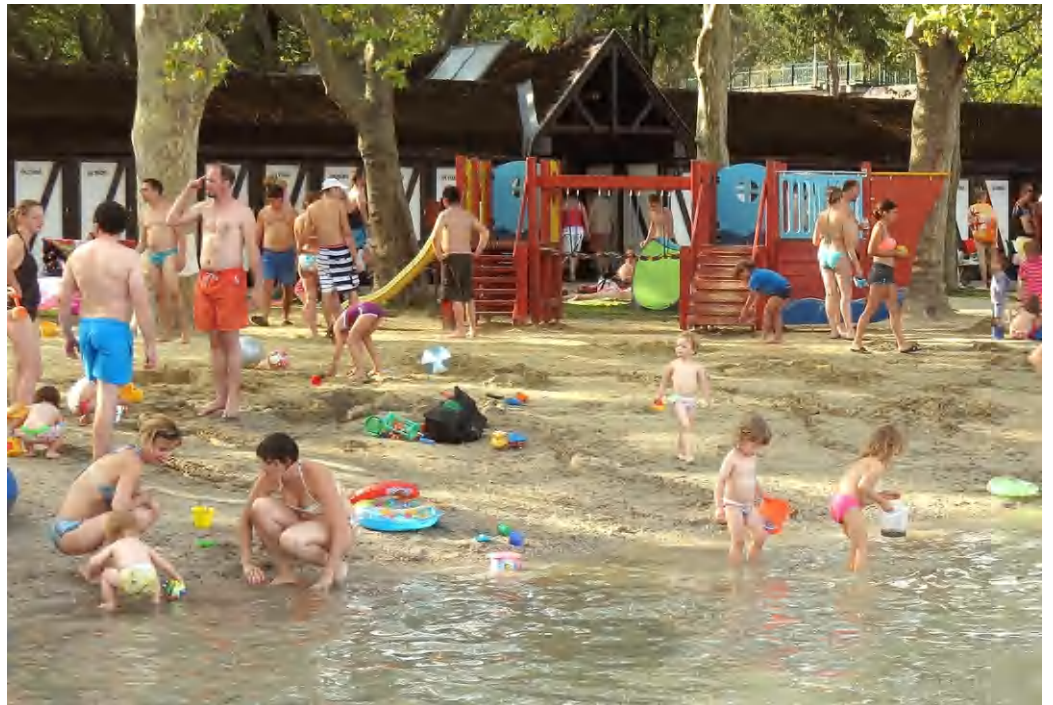
A balatonyöröki strand kapta idén a legjobb értékelést

Erről Győrffy Árpád főszerkesztő tájékoztatta lapunkat. Mint megtudtuk, alig néhány század jeggyel a balatonyöröki strand mögött végzett a gyenesdiási Diási Játékstrand, az alsóörsi Községi strand és a vonyarcvashegyi Lídó strand. A hetedik alkalommal lezárult értékelést 2008-ban indította a portál, hogy maguk a használók véleményt mondhasanak az általuk közvetlenül ismert balatoni strandokról. Hogy az értékelés ne válhasson szavazóversennyé, ugyanazt a strandot mindenki csak egyszer értékelhette. 1-5-ig terjedő érdemjeggyel rögzíthették véleményüket a