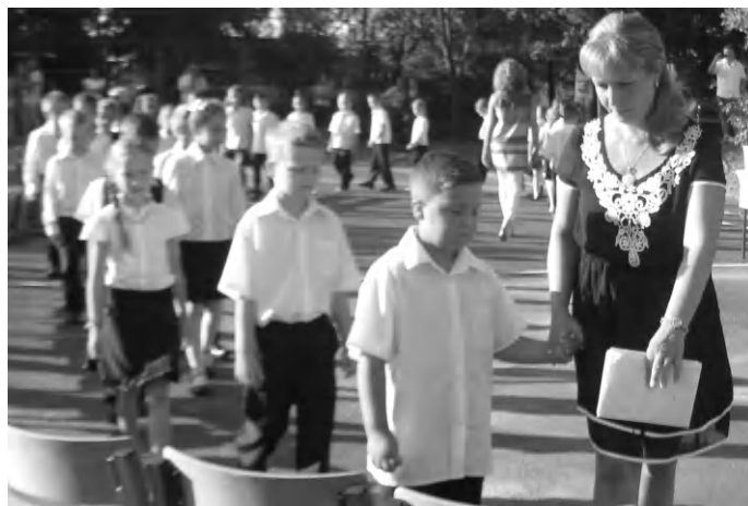
Tanévkezdés, Tapolca, Batsányi