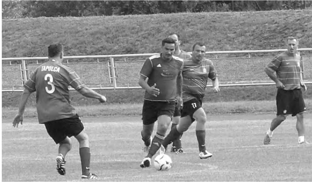
A torna egyik mérkőzésének szép pillanata, pályán a tapolcai öregfiúk

Ezúttal négy csapat mérte össze futballtudását a Városi Sporttelepen, a felvidéki Marcelháza, a szintén szlovákiai Patince, a Tapolcai Öregfiúk FC, valamint a horvátországi Umag csapata. A sportolók kétszer negyedóránként, körmérkőzéses rendszerben rúgták a bőrt. A torna győztese végül Umag lett, 6:2-es gólaránnyal, hét ponttal. A tapolcai öregfiúk egy ponttal lemaradva, hét négyes gólaránnyal szorultak a második helyre. Marcelháza játékosai négy ponttal, négy lött és öt kapott góllal a harmadik helyen vé-