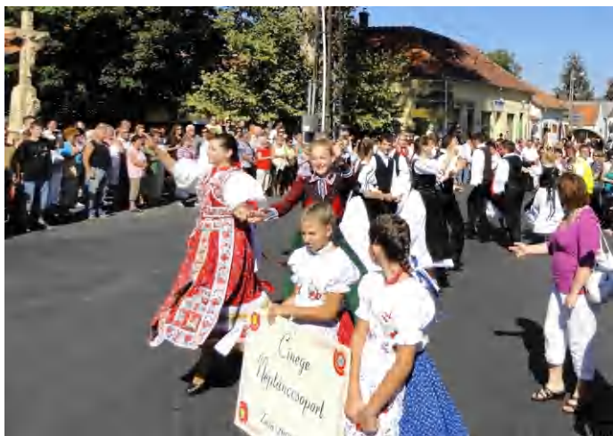
Hétfvégén lesz a híres Badacsonyi szüret

Sokak szerint környékünk legimpozánsabb őszi rendezvénye a híres badacsonyi szüreti felvonulás és a hozzá kötődő programsorozat.