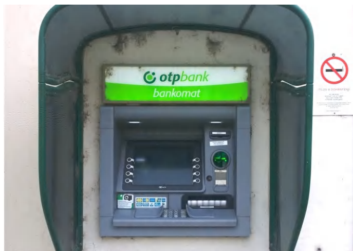
Pókháló „nő” már a bankautomatán is

érdemel mert nyitott, és még zárt helyen is száll a por. Visszont az a tény már sokkal inkább, hogy a szerkezetet lassan pókhálókkaal lesz körbetapétázva. Ahogy olvasónk mondta: „Nekem nincs pókfóbiám, mégis fejszóválva jövök ide. Nem igaz, hogy a felelősöknek nincs egy liter vizük, fertőtlenítőszerük, és öt perc szabadedjük!” Apró dolgokból születnek a nagyok, negatív értelemben is... (di)