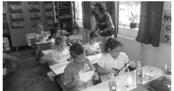
Kézműves foglalkozás a Bárdos iskola gólyatáborában

Folytatva a régi hagyományt, az idei tanév előtt, augusztus utolsó napjainban gólyatáborot szerveztek a Bárdos Lajos Általános Iskola székhelyintézményében a leendő első-