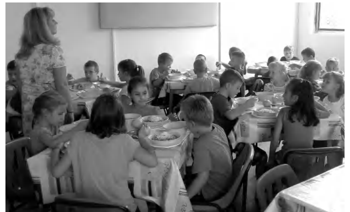
Ebéd közben a gólyatáboros kisdíjak Batsányi Tagintézmény étkezdéjében. Felkészültek az iskolára

Az iskolától kapott információk alapján a két napos táborral próbálták a gyerekek bemutatni az intézményt, az iskolai élet szabályait, rendjét. Fontosnak tartották, hogy a gyerekek a két nap leforgása alatt nagyon jól érezzék magukat, ezért minél több érdekes, és hasznos foglalkozást biztosítottak számukra, amit a tanév folyamán alkalmazni is tudnak. Játékos angol feladatok, kézműves és sportfoglalkozások, jókedv és vidámság megteremtése volt a pedagógusok célja, hogy úgy gondoljon minden kisdíj az iskolára, mintha az a „második otthona” lenne. A meghívókat nyár elején postán küldték ki, ennek megfelelően augusztus 26-án reggel nyolc órakor gyü-