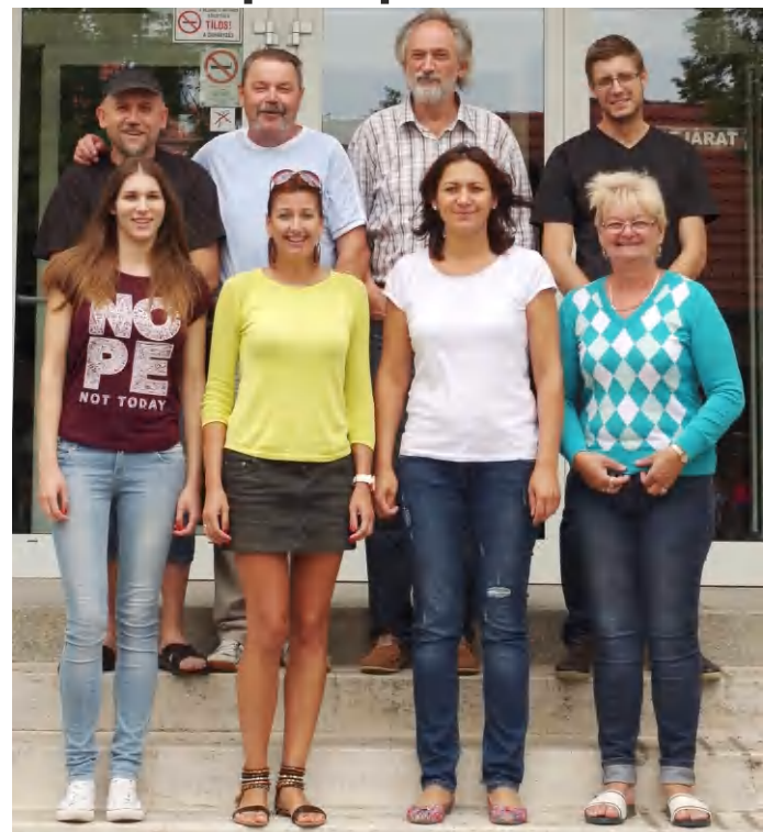
A Tapolcai ünnepi napok és borhét szervezői: a Tapolca Kft. – Tamási Áron Művelődési Központ munkatársai. A rendezvénysorozat minden igényt kielégített