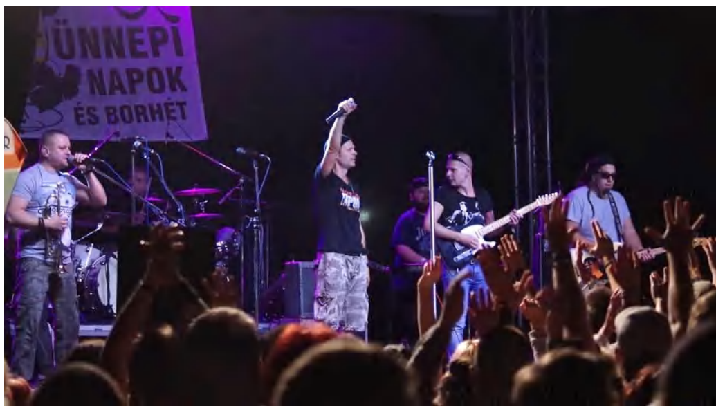
A ska és reggae zene kedvelői az Ocho Macho bulijára táncolhattak