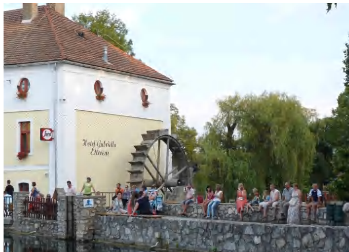
Novemberben újra foroghat a kerék

elmondta: a malomkerék, ahogy azt az érdeklődők láthatják is, a jelenlegi műszaki állapota miatt nem tud forogni. Örömmel adta hírül lapunknak a jó hírt, miszerint a közeljövőben a kivitelező megkezdte a munkálatokat, és előreláthatólag novemberi határidővel át is adja az új malomkereket, amely természetesen forog majd, sőt áramot is fog termelni. (di)