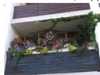
A legszebb tapolcai erkélyek egyike