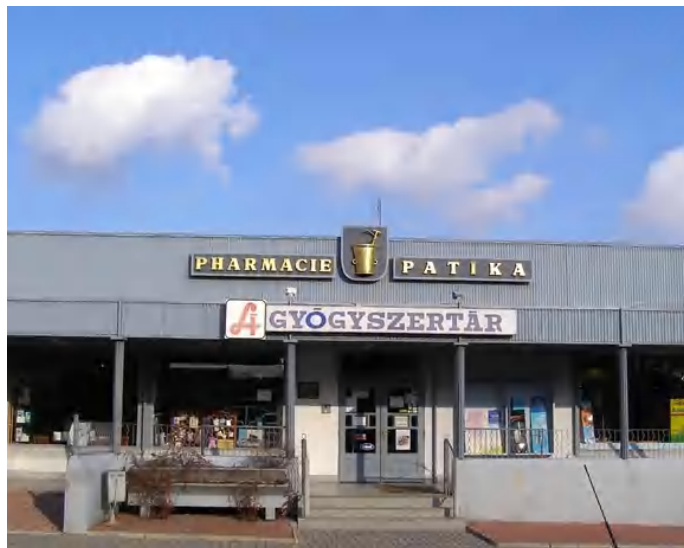
A város gyógyszertárai minden nap elérhetőek, csak nem minden órában

Néhány hónapja változott meg a város patikáinak nyitva tartási rendje, amelyet a tapolcai gyógyszertárak kezdeményeztek, és ez forgalmi adataik tükrében indokolt lépés volt. A minden szempontból megnyugtató megoldást azonban a helyi háziorvosi patikarendszer kialakításában látja a képviselő. – A patikusok statisztikai adatokkal támasztották alá, 2015 első negyedévéig alapul véve, hogy forgalmuk minimális volt este kilenc óra és éjfél között. A teljes vizsgált időszakban mindössze öt esetben került sor antibiotikum, egy-egy esetben bizonyos lázcsillapítók, algopyrin, illetve gyulladáscsökkentő gyógyszerek kiadására. Néhány esetben pedig nem ügyeleti gyógyszerek, fogamzásgátló tabletta vásárlása, illetve elvesztett cumi pótlása volt a patika látogatásának célja. Éjfél, és reggel nyolc között ugyanakkor nem történt a három hónap alatt egyetlen vásárlás sem. A rendkívül kis forgalom miatt döntöttek a patikák az ügyeleti idő csökkentése mellett, amelyről törvényi kötelezéseiket betartva tájékoztatták az