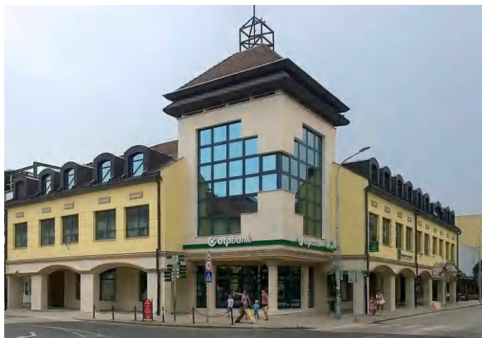
Az OTP Bank tapolcai felújítási munkálatai befejezettek, helyreállt a régi rend

az érintettek által elfogadható műszaki megoldásról. Azóta az OTP Bank Nyrt. az utcafronti és a Fő tér felőli, valamint a belső udvari homlokzaton a kőburkolatot felújította, a tervezővel és a főépítéssel egyeztetettek szerint, ahogy a vakolt felületeket homlokzati színezéssel szintén. Az épület kiemelkedő városképi megjelenése megmaradt, így új „fényében” láthatjuk. (di)