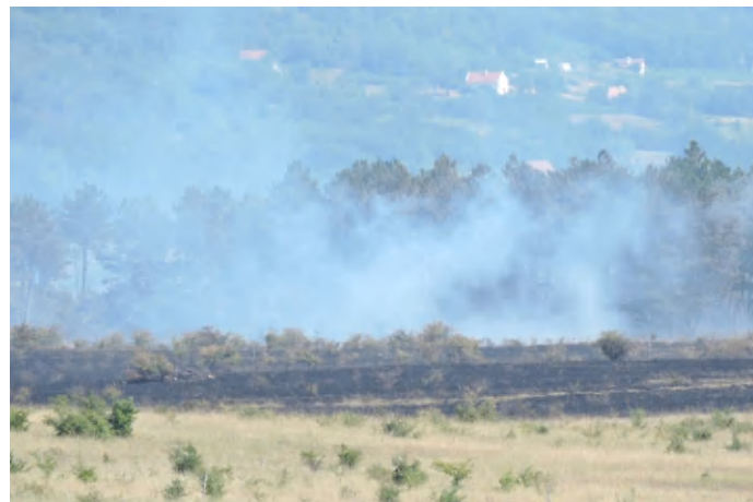
Füstbe borult az erdő Tapolca közelében szombaton. Mintegy 80 hektárnyi avar és másfél hektárnyi erdő égett el pár óra alatt

lutánra lokalizálták, és eloltották, de így is mintegy 80 hektárnyi aljnövényzet, avar égett el, valamint másfél hektárnyi fenyves semmisült meg. (szj)