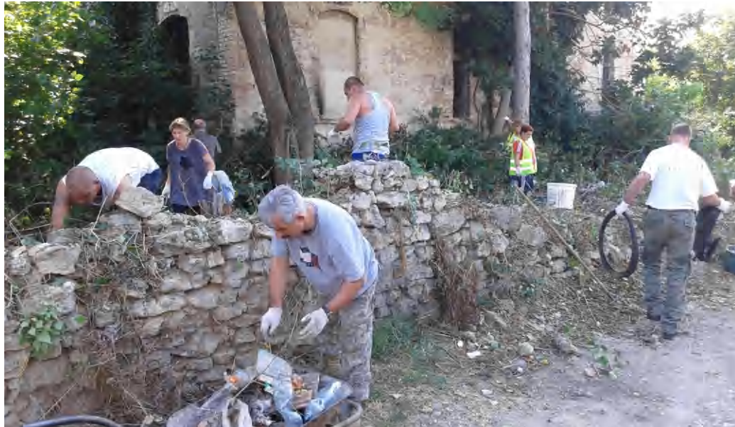
Elég régóta „érett” már a nagytakarítás az elhanyagolt állapotú Keszler-háznál

Amint kifejtette, olyan jellegű kommunális hulladék is lerakásra került a területen,