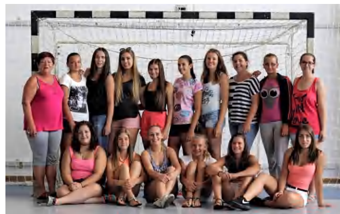
A tapolcai lányok ezúttal az ezüstérmét szerezték meg

Az utolsó találatot az ellenfél vitte be. Ezzel negyedik helyen végzett a magyar férfi párbajtőrválogatott az universiaden. (ae)