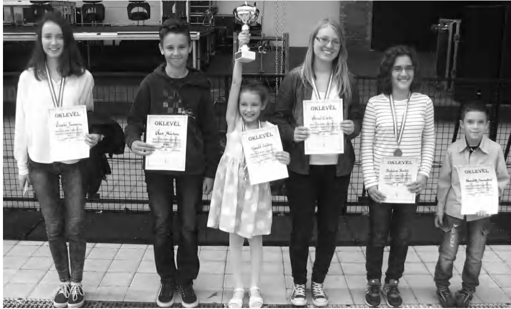
Egy büszke és sikeres sakkozó csapat a nem mindennapi országos szereplés után