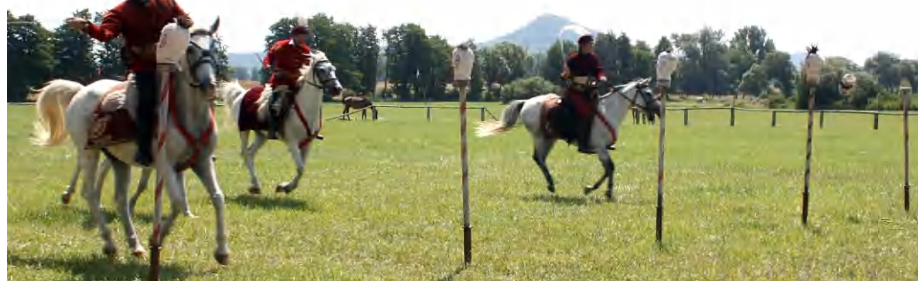
A hétvégén rendezett Gyulaffy-napok néhány emlékezetes pillanata

Mert egy kis reklám mindig elkel a vitéz uraknak is, így különösen szórakoztatóra veszik a hagyományörzők a figurát a népszerű rendezvény első napján. A nagy csinnadratta, a kardcsörtetés végül elérte a célját, sokan felfigyeltek az eseményekre, a tóparton már száznál is többen figyelték a leányvásárt. Itt ugyanis törökök és magyarok egyezkedtek egy csinos lány tulajdonlásán, ami a forgatókönyv szerint sokak halálával és a törökök győzelmével végződött.