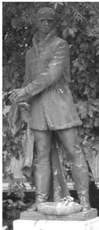
Tapolca nagy költőjének szobra a Malom-tó partján

Aztán az interneten böngészve megláttam a költő első verseskötetének címlap-