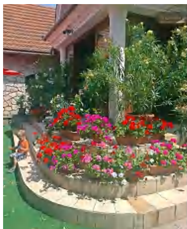
A Szent György Panzió és Étterembe betérő vendéket virágcsodák fogadják

költemények fogadják a vendéget. Az étterem dolgozói a munka mellett a növények ápolására is nagy hangsúlyt fektetnek, ami az elismerő szavak tudatában, már megérte a törődést. Emellett a megújult Tapolcai-tavasbarlang és Látogatóközpont „szomszédjaként” is méltó, nyugodt és szép környezetben ülhetnek le és fogyaszthatnak az éhes, szomjas turisták vagy a helybeliek. (di)