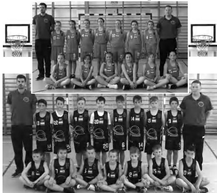
A szépen szereplő tapolcai kosaras leány- és fiúcsapat

Újoncként indultak, s máris szép sikereket mondhatnak magukénak a Tapolca VSE kosárlabda szakosztályának U-11-es sportolói.