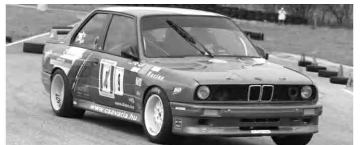
A két szlalomos Lovász nyerő BMW-je verseny közben

A Dunántúli Szlalom Kupa (DSZK) sorozat júniusi bakonyszentlászlói futamát több mint 100 induló részvételével rendezték meg. A tapolcai Lovász kettős ismét jól szerepelt.