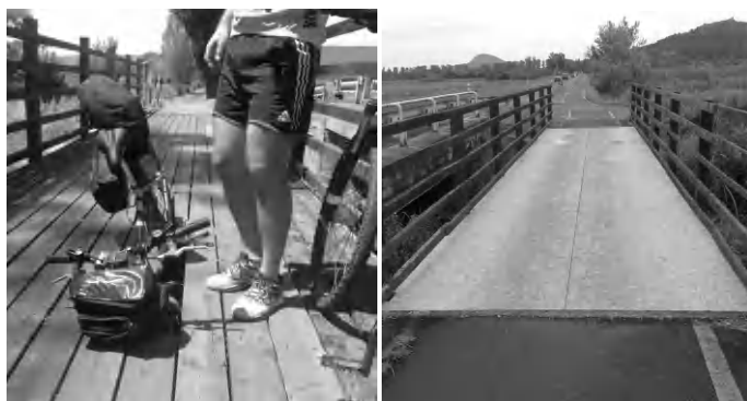
Előtte és utána, a folytatás borítékolható

Rendszeresen kerékpározó hobbistaként látom nap mint nap ezt a közel 25 kilométeres részt, ismerem minden méterét. Tudom, mikor jön a „gyökérbuckasor”, a „meglepítés kátyú”, a kellemes új szakasz, a kellemetlenül rázós régi, a leszűkülő, a kiszélesedő, a bokor benyúlásos, a széleken méteres fűvel benőtt... na és a hidak. Azok a jó öreg hidak, amelyeket évről évre a területileg illetékes önkormányzatok (Balatonederics, Szigliget) foltoztatnak, hiszen foltoznivaló mindig van rajtuk. Ugyanis sem a lucfenyő, sem az OSB lemez nem igazán bírja a páras környezetet, hajlamos a rothadásra, szétesésre mindkettő, különösen, ha vízszintesen helyezik le. Persze