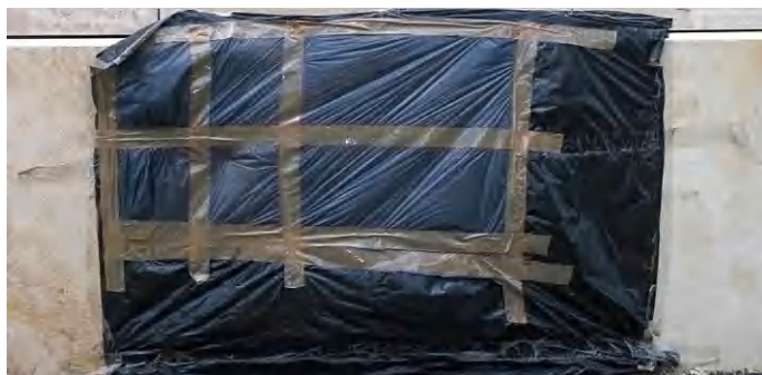
Nyárra ígérik a sérült márványtáblák cseréjét