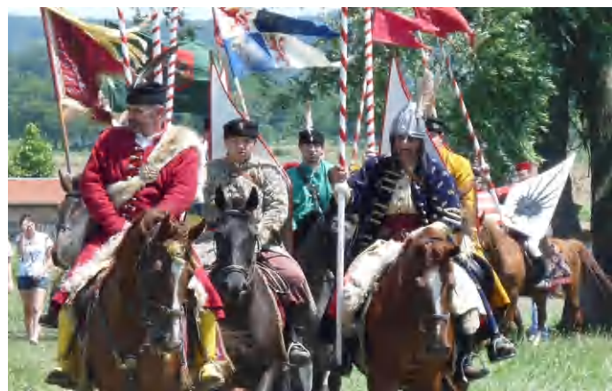
Hazánk legnagyobb végvári rendezvényét tartják meg a Csobáncnál ezen a hétfőn