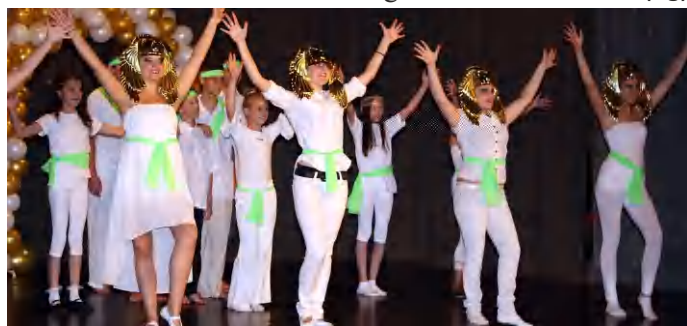
Sikert aratott Tapolcai Musical Színpad

színes szélesvásznú álomkabát, a Hotel Menthol című darabokból és Cserhádi Zsuzsa munkáságából. Az idősebbek és fiatalok produkcióját kiegészítette és emelte Őri Jenő zongorajátéka. A közel két és fél óras hangkavalkádot szünni nem akaró tapssal díjazta a többségben szülőkből és hozzátartozókból álló, lelkes közönség. (hg)