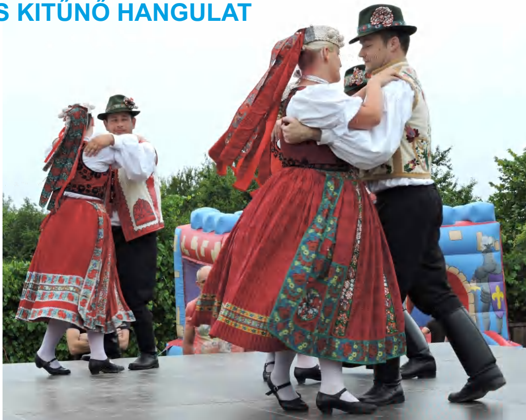
A Batsányi Táncgyűttes remek produkcióval kápráztatta el a közönséget