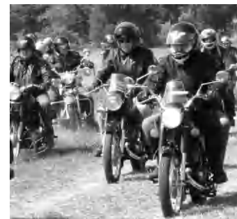
Immár tizenöt éve találkoznak Diszelben a veterán motorosok.

megmutattuk magukat és gépeinket. Sőt, a Rozsdamarók klub több tagjának aktív részvételével mintegy másfél órás vidám színpadi előadást is láthatott a diszeli közönség - hangsúlyozta Mohos Csaba.