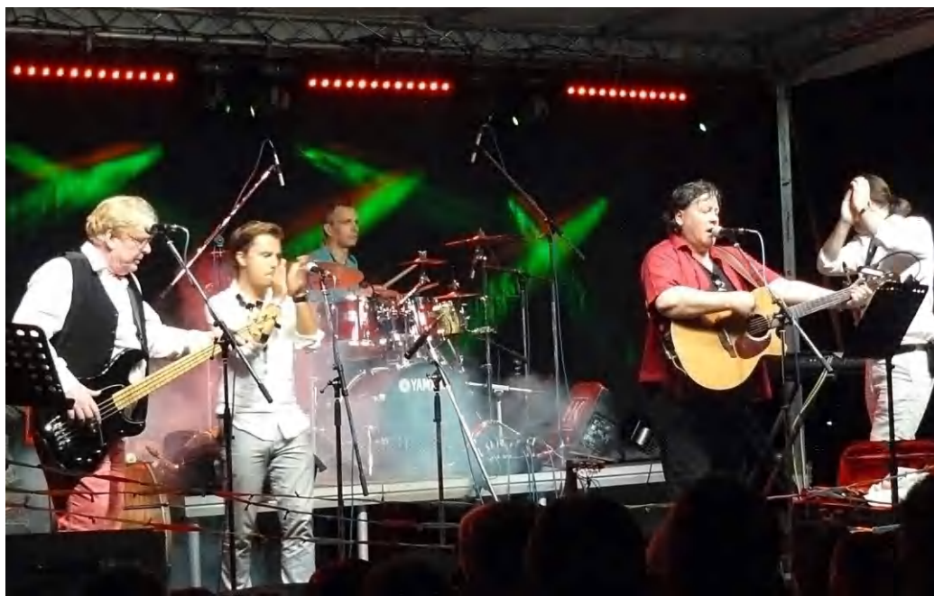
A Szent György-hegyi színpadon a Ghymes a tizedik fesztiválon

Már a kezdés se volt szokványos, hiszen civil öltözköb, rövidnadrágban, szoknyában, pólóban néptáncos fiúk, lányok jelentek meg a színpad környékén és az akkor még cd-ről szóló népi muzsikára táncolni kezdtek. A közönség hamar kedvet kapott és nemsokára száznál is többen táncoltak, az elején még külön-külön, majd párban, később egy nagy kört alkotva, egymásba kapaszkodva. Ahogy a koncertváró hangulat a tetőfokára hágott, színpadra léptek és a húrokba csaptak a fiúk, még a jó fénytechnika és a füstköd sem hiányzott az élményhez. A Ghymest a környező ma-