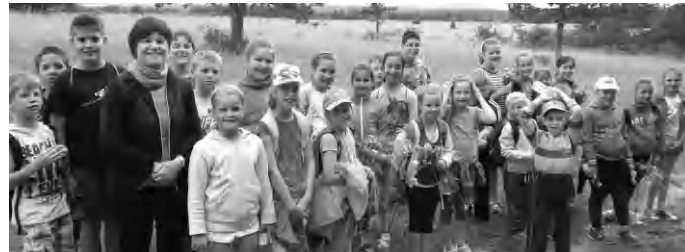
Tapolcai kazinczys gyerekek a napközis táborban