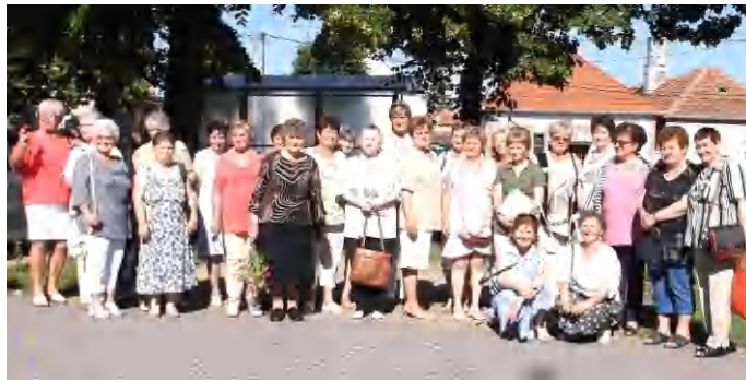
Az utolsó tapolcai lányosztály a Köztársaság téren, ahol gyakor a fákat ültették általános iskolás diákként