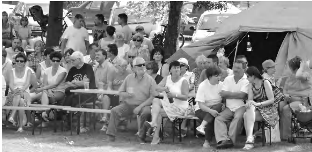
Hat ország magyarjai találkoztak a monostorapáti falunapon