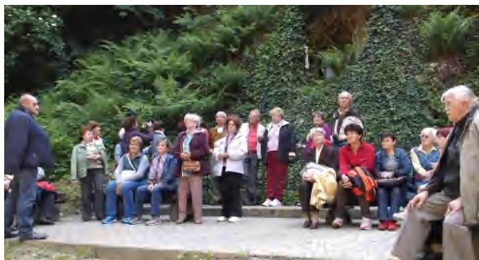
Rövid pihenő a különlegesen szép környezetben

A délutáni program Vasváron folytatódott, ahol a először a Katonák útját nézték meg, egy szép parkerdőben. - A római kori sánc és a középkor katonai határőr kapujához, majd Szentkúti búcsújáró helyhez sétáltunk fel, amely egy ősbükkös szépséges természeti környezetben kápolnával, úgynevezett lourdes-i barlanggal, kristálytisza forrással kápráztatott el bennünket. A program közös vacsorával zárult. (szj)