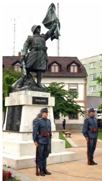
Az I. Világháborús emlékmű állításának 85. évfordulójára alkalmából tartották megemlékezést a minap Tapolcán