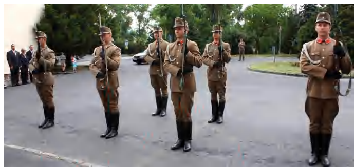
A Budapesti Helyőrségi Dandár tiszteletadása