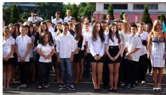
A Kazinczyban is zárták a tanévet

A szorgalom és kitartás dönti el, kiből lesz diplomás vagy a társadalom számára épp oly fontos szakember. A ballagó tanulók végül színes lufikat engedtek a magasba, jelezvén a világnak, hogy készen állnak a folytatásra, álmaik megvalósítására. (hg)