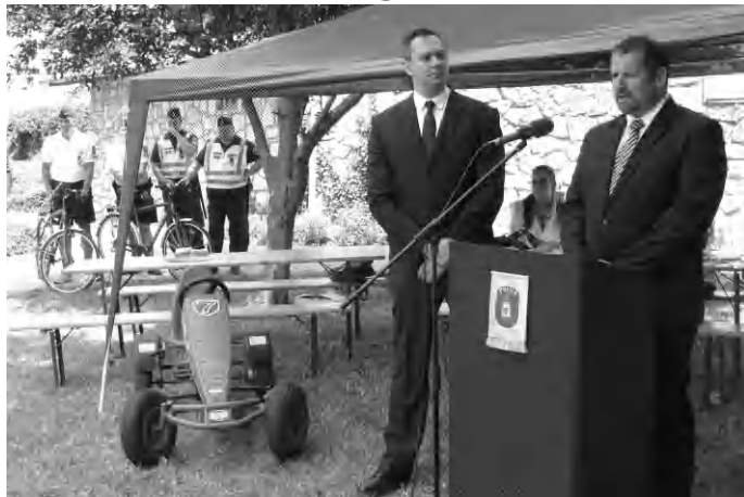
Fokozott rendőri jelenlétet ígérnek

Erről tartottak sajtótájékoztatót a minap az tóparton az illetékes bűn-, és balesetmegelőzési szervek. Tapolcai részről Koleszár Zsolt bűnmegelőzési előadó arra hívta fel a figyelmet, hogy idén kimelt figyelmet fordít a rendőrség arra, hogy a turisztikai szezonban garantálják az itt élők, illetve a