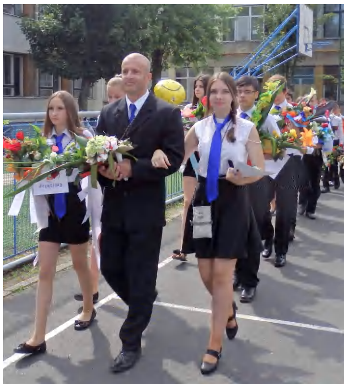
A Batsányi tagintézmény nyolcadikos diákjai elbúcsúztak a tanévzáró ünnepségen

A 2014-2015-ös tanév utolsó közös programjára, a ballagásra és az évvizárra gyülekeztek szombaton a Batsányi tagintézmény tanulói, tanárai, szülők és vendégek.