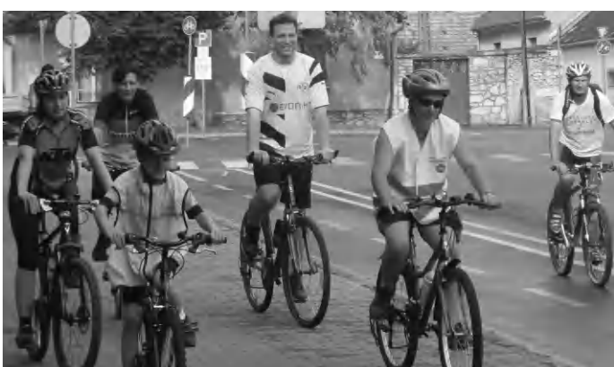
Hangulatos bringásprogram Tapolcán

■ TÚRA - A Tapolca VSE természetjáró szakosztály szombati (2015.06.20.) túraprogramja: Zalaszentotthony-Resz-vár-Cserszegtomaj-Keszthely, a táv mintegy 16-17 kilométer. Találkozó a tapolcai autóbusz-pályaudvaron szombaton reggel 7.05-kor. (szj)