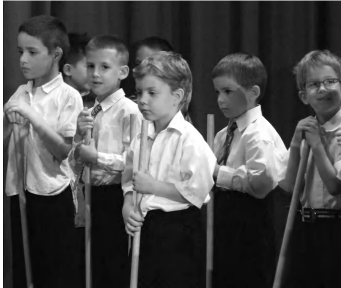
Az óvodás gyerekek a Mátyás király és az igazmondó juhász című népmesét adták elő hatalmas sikerrel a Tamási Áron Művelődési Központban

Azt kívánta a jelenlévőknek, hogy legyen idejük megtanulni a gyerekektől ezt a fajta önfeledt örömet és megtapasztalni az apró szépségeket a mindennapi életben. A gyerekek a Mátyás király és az igazmondó juhász című népmesét adták elő, zenés-