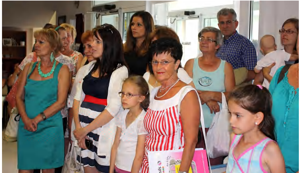
Aktív és nyugdíjba vonult védőnők is ellátogattak a kiállításra

Hungarikummá vált a Védőnői Szolgálat, mint nemzetközileg is egyedülálló, tradicionális ellátási rendszer. A 100 éves évforduló alkalmából kiállítást nyitottak a Tamási Áron Művelődési Központban, ahol Dobó Zoltán , polgármester is méltatta a védőnőket, mint gyakorló apa, és mint egy közösség vezetője. Háláját fejezte ki, hogy a sokszor evidensnek tűnő, túl aggodalmas szülői kérdésekre mindig higgadt és szakmai választ adnak. Hivatásnak, nem pedig szakmának nevezte munkájukat, melyet szívvel lélekkel végeznek. A megnyitó beszédet követően, régi, a múltat idéző Híradó-bejátszásokat vetítettek. A képkockákon fehérru-