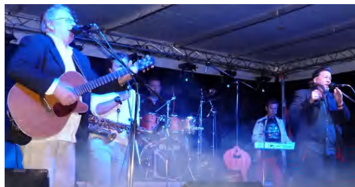
Július első hétvégéjén ismét Ghymes