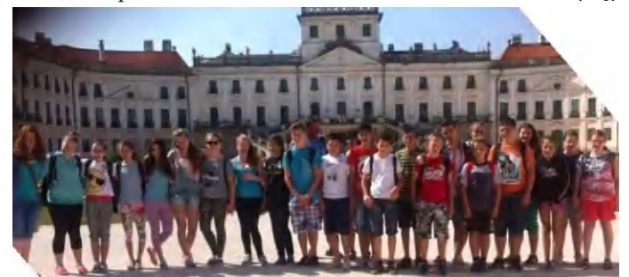
A Bárdos iskola 7. osztálya a jutalomkiránduláson