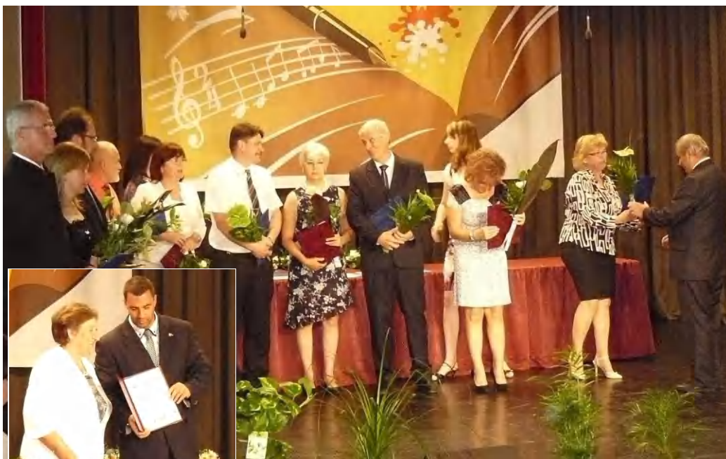
Az idei pedagógusnapon is elismerték a tanév során végzett nehéz, áldozatos munkát

A Tamási Áron Művelődési Központ adott otthont a pedagógusnapi ünnepségnek, amelyet Tapolca, a Klebelsberg Intézményfenntartó Központ Tapolcai Tankerülete és a járás települései támogattak. Tóth Mária ünnepi beszédében Mérei Ferenc meghatározásával írta le a jó pedagógus ismérveit. - Teremtsen atmoszférát, nyújtson biztosságot, szeresse a növendékét, tegye értékévé a teljesítményt, legyen nagy hatású. Az oktatói munkát ma túlterheltség jellemzi, amit a társadalom nem lát, hiszen nem látja a felkészülési időt, az anyaggyűjtést, a dolgozatjavítást, a folyamatos adminisztrációt, adatszolgáltatási kötelezett-