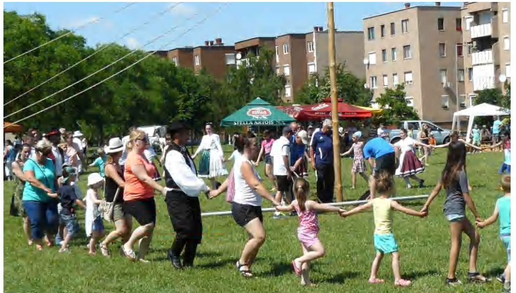
A májusfa kitáncolása hagyományos része a gyermeknapi programnak

Az időjárás is kegyes volt a kilátogató tapolcai családokhoz, nyári klíma alapozta meg a hangulatot. Volt minden amire a legfiatalabb korosztály vágyik az ugrálóváltól a ringlisspílen át a lufibohócig, de az óriás csúszda, a kisállat simogató, darus sörösrekeszmászás, a kézműves- és sportprogramok sokasága, de a profi zenés gyermekműsor sem hiányzott a szórakoztató eszköztárból. A rendezvény nem csak a kicsikhez, az egész családhoz szólt, a Batsányi néptáncosok produkciója, a májusfa kitáncolás, a selymásműbemutató, a legjobb majálisokat idézte és egyaránt élmény volt kicsiknek és nagyoknak. Az ENSZ közgyűlése 1954-ben javasolta, majd határozatot is hozott róla, hogy minden országban tartsák meg a „nemzetközi gyermeknapot”. Az ünnep célja, hogy megemlékezzenek a világ gyermekeinek testvériségéről és egymás közti megértésről, valamint a gyermekek jóléte érdekében kifejtett küzdelemről. Javasolták a kormányoknak, hogy mindenhol olyan napot jelöljenek ki erre a célra, amit megfelelően gondolnak. Érdekesség, hogy Magyarországon már állami szinten 1931-től gondoltak a kicsikre és létrehozták az úgynevezett gyermeknapot. A mai értelemben vett gyermeknap 1950-től, tehát az ENSZ határozatot négy évvel megelőzve létezik Magyarországon. Tapolcán a Csermák József Ren-