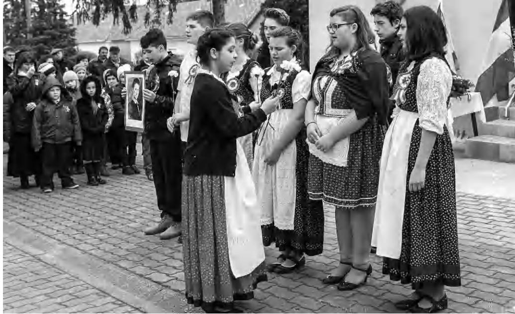
A gyerekek adták műsort március 15-én Monostorapátiban

Ünnepi szentmisével, kulturális műsorral emlékeztek meg Monostorapátiban 1848. március 15-ről.