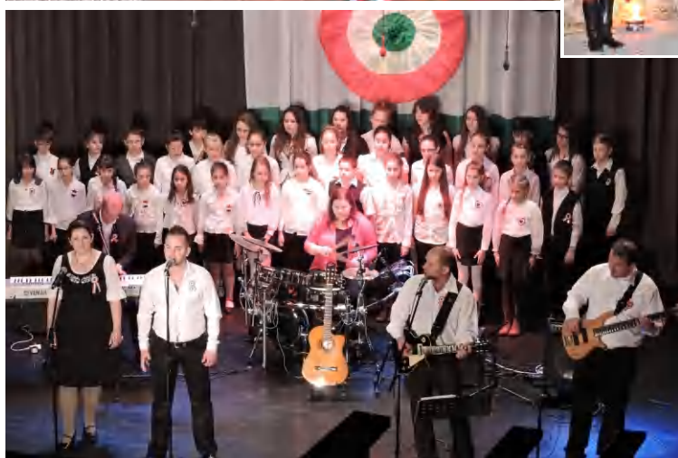
Az ünnep Tapolcán 2015. március 15-én Fotók: Sziujártó, Havasi