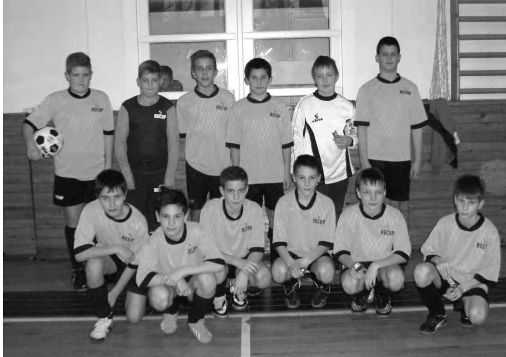
Bronzérmet szereztek az U-12-es focista palánták a Sümegen rendezett tornán

A bajnokság kezdete előtti utolsó felméréseken, teremtornákon szerepelnek az ifjú focisták. Ilyen alkalom volt a hétvégén Sümegen rendezett hatszempatos torna is, melyen a hazai két gárdán kívül Zalaszentgrót, Celldömölk, Jánosháza és a TIAC focistái rúgták a bőrt. Körmérkőzéseket játszottak 1x15 perces játékidővel. A tornát színvonalas, izgalmas, küzdelmes összecsapások jellemezték, ahol a végső helyezések szinte csak az utolsó pillanatokban dőltek el. Jó példa erre, hogy tapolcai gyerekek a tornagyőztes Celldömölk ellen 3:0-s vezetés után kaptak ki 4:3 arányban. Sümeg „A” csapatát 2:1-re, „B” csapatát 2:0-ra, Jánosházát 5:1-re győzték le. Vereség Zalaszentgróttól 2:0 arányban és Celldömöltkől. A torna vég-