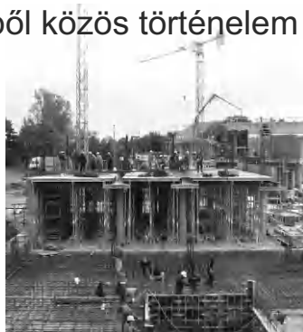
Épül a Hotel Pelion. Egy pillanatkép 2002-ből

Alig több mint egy év múlva, 2016. március 31-én ünnepeljük Tapolca újbóli várossá nyilvánításának 50. évfordulóját. A Wass Albert Könyvtár és Múzeum szeretne a maga eszközeivel hozzájárulni ahhoz, hogy a város méltó módon emlékezhessen meg történelmének utolsó fél évszázadáról.