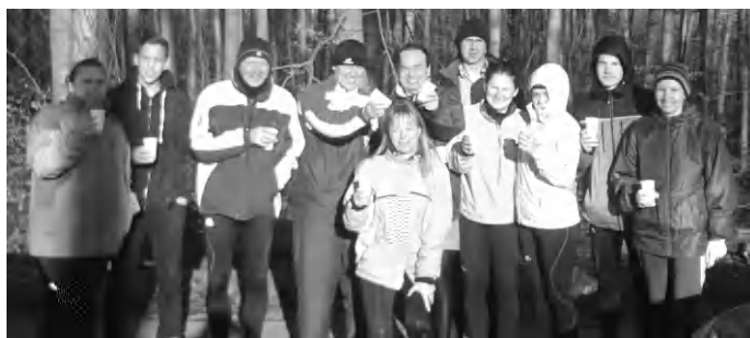
Tapolcai Trappolók: Futni minden évszakban lehet