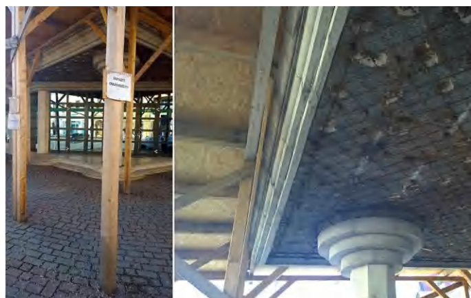
Omlásveszély miatt 2014 augusztusában aládúcolták az épületet. Vajon mikor hárítják el a hibát?

Természetesen ezúttal is várjuk és közöljük az illetékes(ek) lapunkhoz eljuttatott válaszát, reagálását. (di)