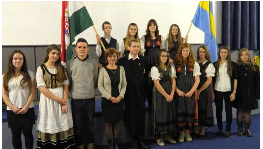
Wass Albert munkásságára emlékeztek a Városi Moziban

Rig Lajos alpolgármester beszédében így fogalmazott: - Ha rátekintünk arra a plakátra, amely erre a rendezvényre hív minket, akkor egy ereje teljében lévő katonámbert látunk. Tőle félne bárki is? Az nem lehet, hiszen a derék katona immár 17 éve halott. Tehát nem fizikai mivoltától félnek ellenségei, sokkal inkább a lelkületétől, a gondolataitól, azoktól a szavaktól, melyek elhangzottak szájából. Ebből az következik számunkra, hogy a szó sokkal erősebb a kardnál. Ettől a nagyszerű embertől, költőtől, írótól bármit is olvasunk, nem találunk olyan művet, de még egy mondatot sem, amely a gyűlölettel, harag-