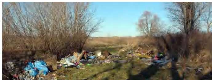
A ronda látvány önmagáért beszél

meg a csúnya szeméthalmokat, amelyek hétről hétre nőnek. Arról nem is szólva, hogy a Raposka felől érkező személyvonatok ablakából tökéletesen látni a hulladékot. A szemétlőknek pedig most is csak bottal üthetjük a nyomukat! (di)