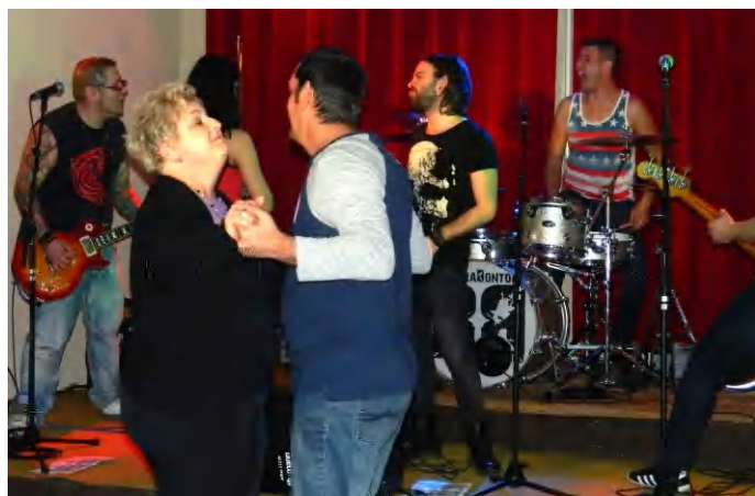
Tapolcán játszott a Barabonto zenekar