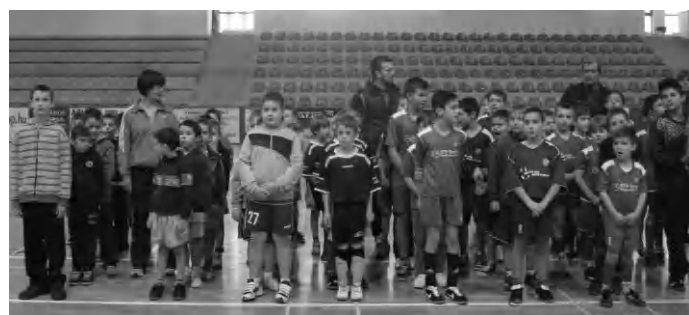
Eredményhirdetésre várnak a gyerekek