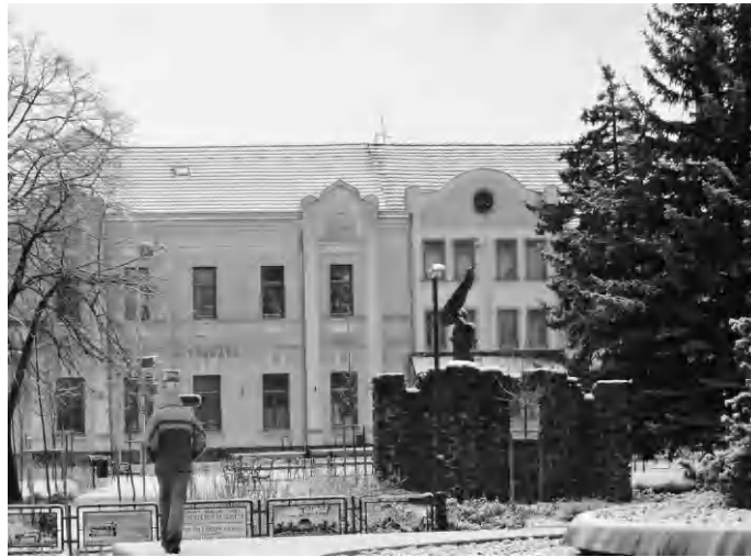
A rendelettel kapcsolatban személyesen is lehet érdeklődni a Tapolcán a városházán