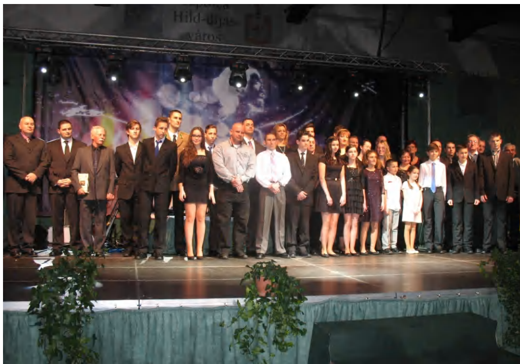
Az idei sportgálán is bőkezűen osztották a díjakat a város eredményes sportolói, a sport területén, vagy annak közelében ténykedő szakemberek részére

Ezt követően Dobó Zoltán, Tapolca polgármestere köszöntötte a megjelent sportolókat, edzőket, sportvezetőket, olimpikonokat, világbajnokokat, edzőket, vendégeket. Köszöntőjében kiemelte a sport fontos szerepét az emberek életében, annak közösségformáló erejét. Egyúttal köszönetét fejezte ki azoknak a sportolóknak,