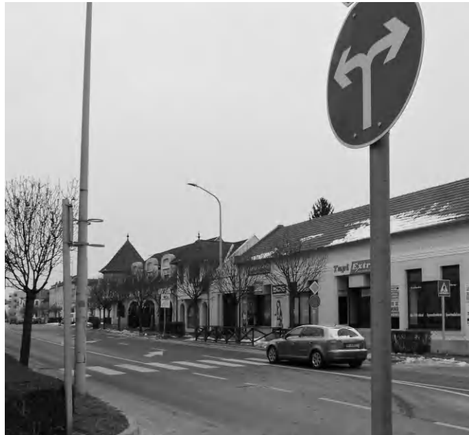
Egyesek szerint veszélyes a Wesselényi utcából való kihajtás, míg mások szerint nem az

A cikkben a Wesselényi utca végén lévő „balesetveszélyes” közlekedési helyzetről esik szó. Mivel az érintett utcában lakom 35 éve, 19 éve pedig már jogosítvánnyal rendelkező, autót használó állampolgár vagyok, azt hiszem kellő tapasztalattal rendelkezem ahhoz, hogy bátran kijelentsem, egyáltalán nem balesetveszélyes, és nem problémás a két irányban engedélyezett kihajtás. Emlékeim szerint az utca forgalmi rendje többször változott, legutoljára a balra kikanyarodást illetően. Nem vagyok közlekedési szakértő, de ebben az esetben a balra kikanyarodó autósoknak egy külön sáv áll rendelkezésére, a Keszthelyi útról és a Dózsa utca felől érkező autósoknak történő elsőbbségadási kötelezettség teljesítésére. Ebbe a sávba kizárólag a Wesselényi utcából balra kanyarodó autósoknak lehet behajtani, majd onnan jobb-