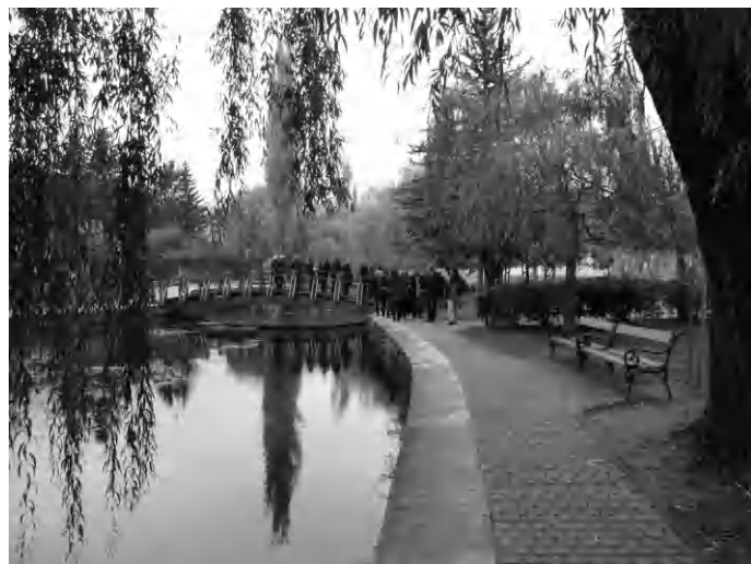
A város egyik csodálatos része a tó és annak közvetlen környéke. A szépítés idén is folytatódik

egyaránt, a tér peremén található épületek pedig méltó előkertet kapnak - fejtette ki Dobó Zoltán polgármester. A projekt tópartot érintő felújítása a 2002-ben elkezdett felújítási munkák soka-dik üteme már, a szépítés minden évben napirenden van. Jelenleg három helyszínt érint a felújítás, a Fő tér 6-8. belső udvarát, az úgynevezett „romkert” és a Batsányi János utcai gyalogos lejárót. A Fő tér 6-8. belső udvarában a meglévő közlekedési felületek mellett csúszásmentes burkolattal ellátott lépcső nélküli sétány kialakítása, és a zöldterület bővítése szerepel a tervekben. A romkert elhanyagolt területén a meglévő tóparti területekhez hasonló pihenőhely lesz. A projekt kivitelezése megkezdődött, a munkákat a közbeszerzési eljárás nyertese, a tapolcai Fülöp Környezetépítő és Szolgáltató Kft. végzi. A munkálatok befejezése áprillisi végére várható. (szj)