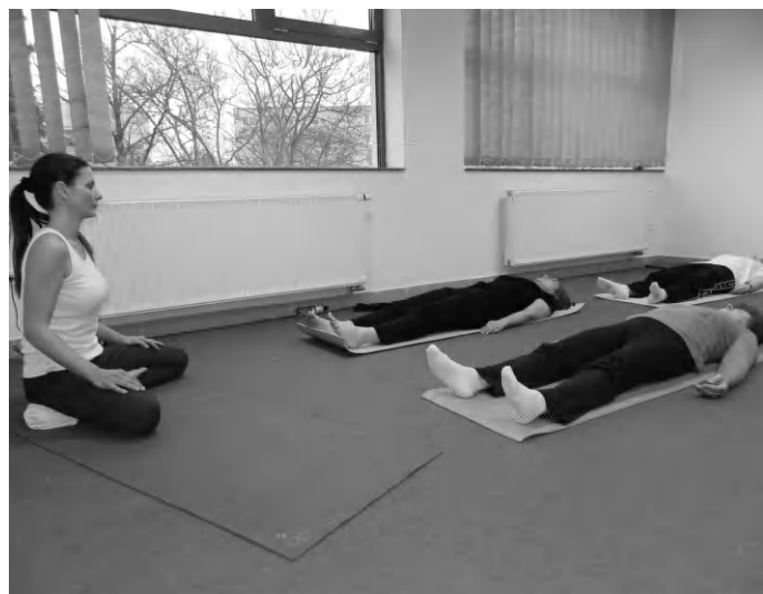
A jóga célja a testi és szellemi erők felébresztése, valamint a közérzet javítása

A projekt célja, hogy a kistérség lakosságának egészségfelfogását pozitív irányba elmozdítsa, ezáltal egészségesebb, aktívabb, termelékenyebb és hosszabb élethez juttassa. A célok eléréséhez az egészségfejlesztést helyezi előtérbe. A fejlesztés eredményeként hosszú távon létrejön az egészségfejlesztési szereplőket összefogó, szakmailag irányító szervezet, amely képes a rendelkezésre álló források és kapacitások hasznosu-