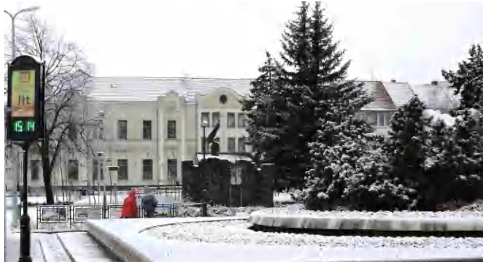
Folytatódhat a Hősök terén a parkfelújítás. A projekthez pályázati támogatás is társul

Az első ütemben megkezdett növényültetések folytatódhatnak, a kertberendezés ki egészül új padokkal, pollekkal, lócékkal, hulladékgyűjtővel, kerékpártárolóval és egy tájékoztató táblával. (Írásunk a 2. oldalon „Meggészépülő területek... címmel folytatódik). (szj)