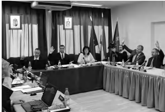
Szavaz a város képviselő-testülete egy korábbi ülésen. Rövidesen a költségvetésről is dönthetnek

- Áttekintjük, hogy lehetnek-e esetleg új, eddig ki nem aknázott bevételi lehetőségei a városnak, átnézzük a helyi adókat, kintlévőségeket és azt is, hogy vannak-e értékesíthető tételei az önkormányzatnak. A város cégei szintén górcső alá kerülnek, hiszen mindegyik jelentős kerettel gazdálkodik. Az önkormányzat a korábbi időszakban a költségvetés terhére tagi hitellel segített a Tapolcai Diák-, és Közétközvetítő, Szolgáltató Kft. működését. Bízunk benne,