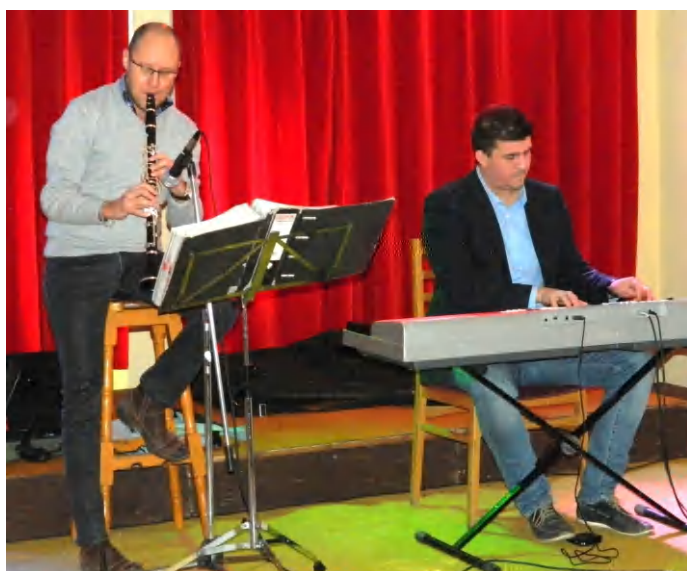
A Babos Piller Jazz Duo jazz-muzsikával és örökzöld slágerekkel szórakoztatja a közönséget

Több városi rendezvényen találkozhatott már velük a helyi közönség, legutóbb a VOKE-ban. (hg)