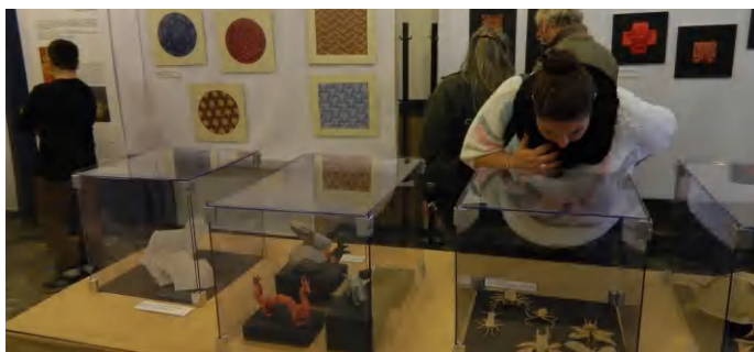
A kiállítás február 13-ig tekinthető meg

Szemet gyönyörködtető origami kiállítás érkezett a városba a Voke Batsányi János Művelődési és Oktatási Központba, amelynek apropóját a tavaly 25 éves Magyar Origami Kör jubileuma adta. A vándorkiállítás február 13-ig tekinthető meg.