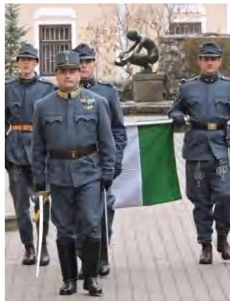
A Don-kanyarban elesett katonákra és munkaszolgálatosokra emlékeztek Tapolcán