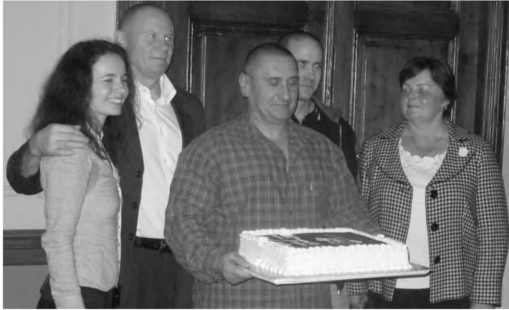
A Tapolcai VSE karateszakosztályának tagjai a szülinapi tortával