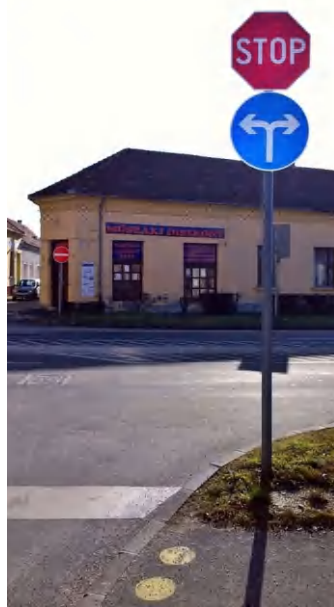
A két irányba történő kihajtást többen balesetveszélyesnek tartják

dolgát az is nehezíti, hogy szinte teljesen ki kell engedni az autó első felét az útra, hogy láthatóvá váljék a Hősök tere és a Keszthelyi út felől érkező forgalom. (di)